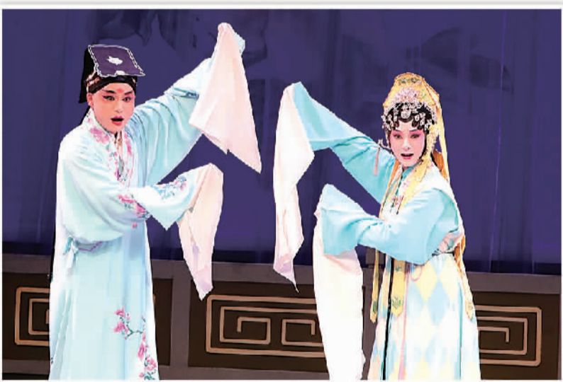
江苏省苏州昆剧院演员在香港为观众示范演出昆曲折子戏《玉簪记·秋江》。