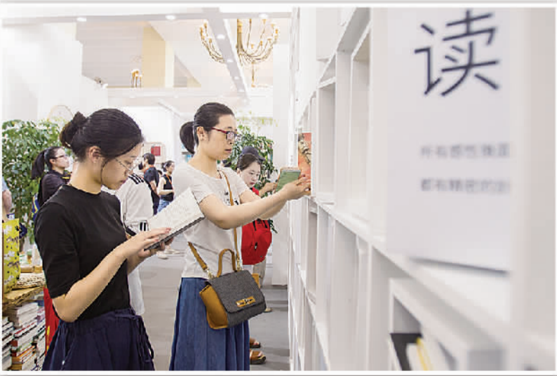
2017上海书展汇聚全国500多家出版社参展，15万余种图书供读者现场挑选。