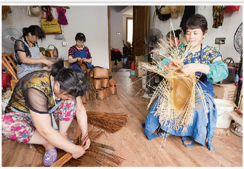
浙江安吉不断提升传统竹制品文化内涵，去年竹产业实现总产值200亿元。