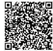
扫描二维码观看更多视频和照片