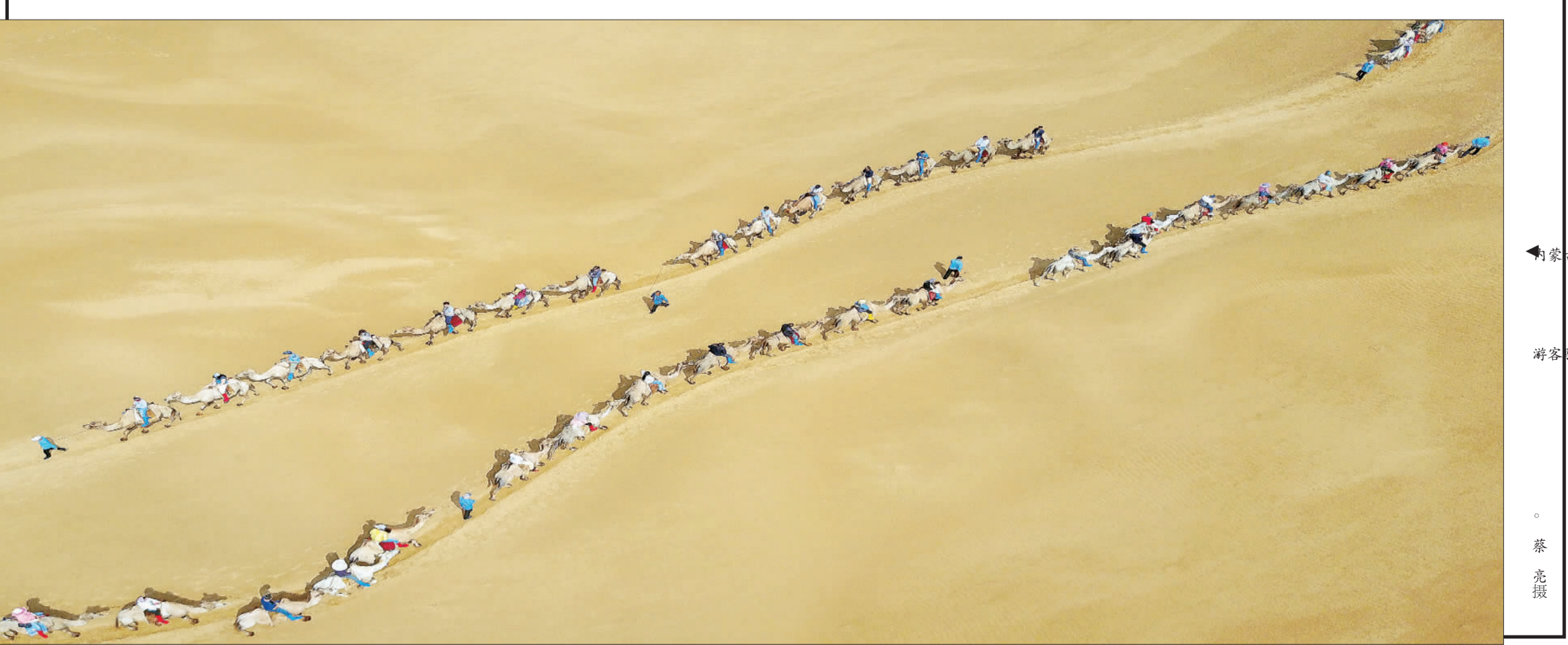
►内蒙古游客骑骆驼