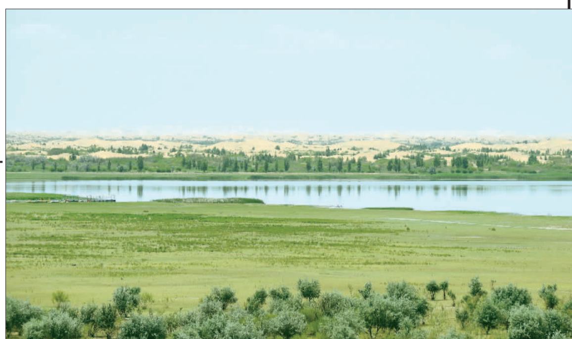
►内蒙古鄂尔多斯杭锦旗库布其沙漠七星湖美景。本报记者 高兴贵摄