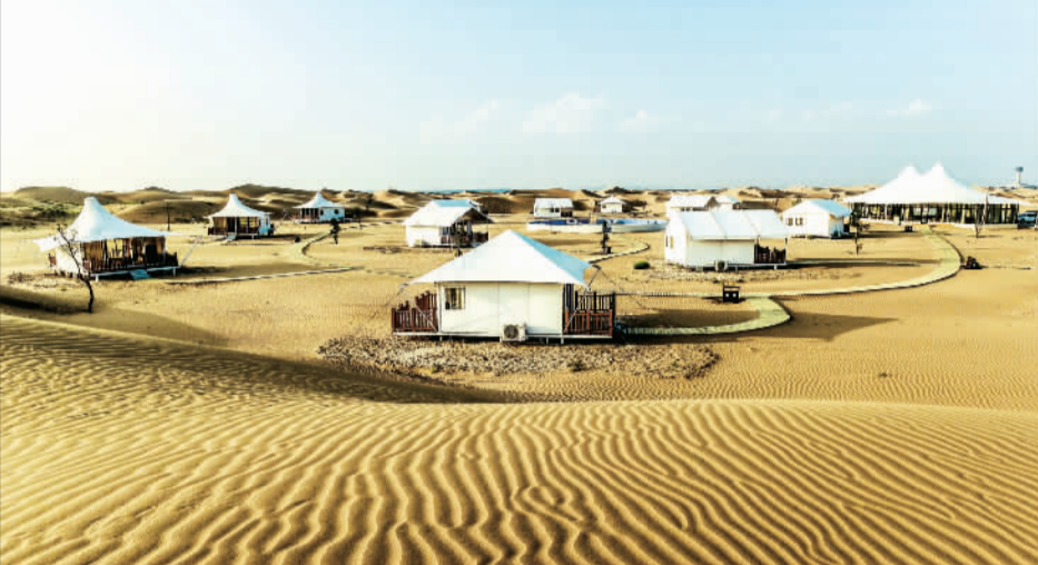
▲宁夏中卫市沙坡头景区的沙漠小镇。