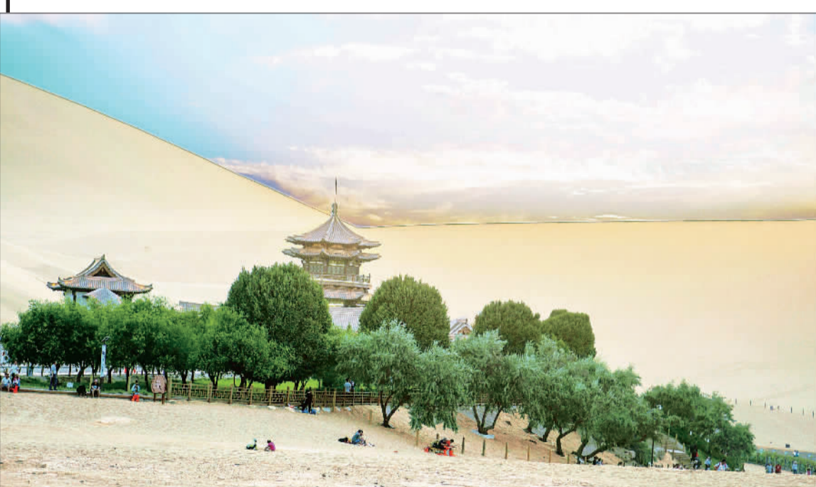
►甘肃敦煌鸣沙山月牙泉景区风光壮美。

本版主编 李景录 编辑 高兴贵 邮箱 jjrbsyb58392306@163.com