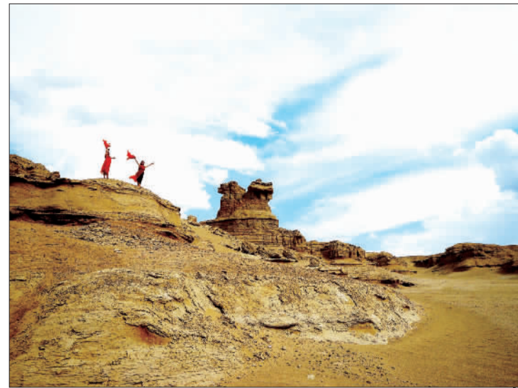
▲新疆哈密市五堡乡雅尔丹地貌生态园。

闹嬉戏，在沙漠里自由追逐。沙漠游玩看新奇。响沙，又叫鸣沙，是一种奇特的自然现象。在甘肃敦煌鸣沙山，骆驼队绵延数公里，滑沙游客接踵比肩。当地人讲，鸣沙山有两个奇特之处：人若从山顶下滑，脚下的沙子会鸣鸣作响；白天人们爬沙山留下的脚印，第二天竟会痕迹全无。而内蒙古响沙湾，是一片被草原包围的沙漠。这里的沙山高110米，坡度45度，形成一个巨大的沙山回音壁。当人们从山顶向下滑动，便会听到巨大轰鸣声。