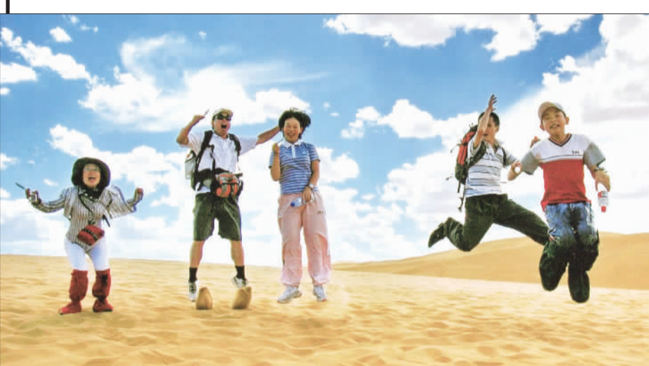
▲宁夏沙坡头景区，游客尽情享受夏日沙漠美景。