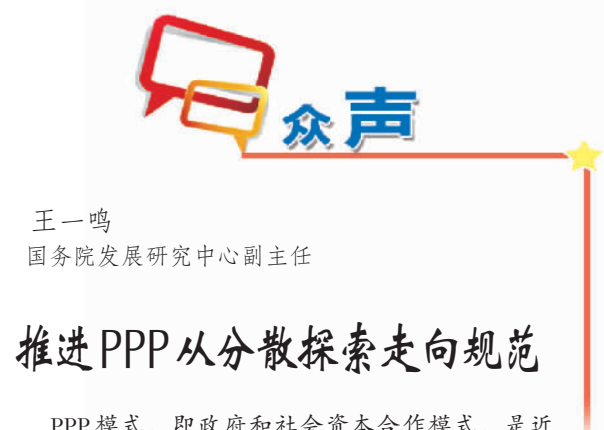
王一鸣 国务院发展研究中心副主任

无论制定规划还是实际操作，都要以我国的根本利益和经济安全为依据，立足国情，从实际出发，既统筹内外、远近、虚实，又保持定力，顺势而为，积极作为。各方唯有共同努力，形成资本市场的良好生态，股市投资才能更好地发挥经济晴雨表的作用，才能对实体经济发展发挥前哨作用、引导作用。