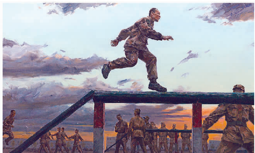
《练兵》 油画 尹明星、姜鸿泰、韩俊洋