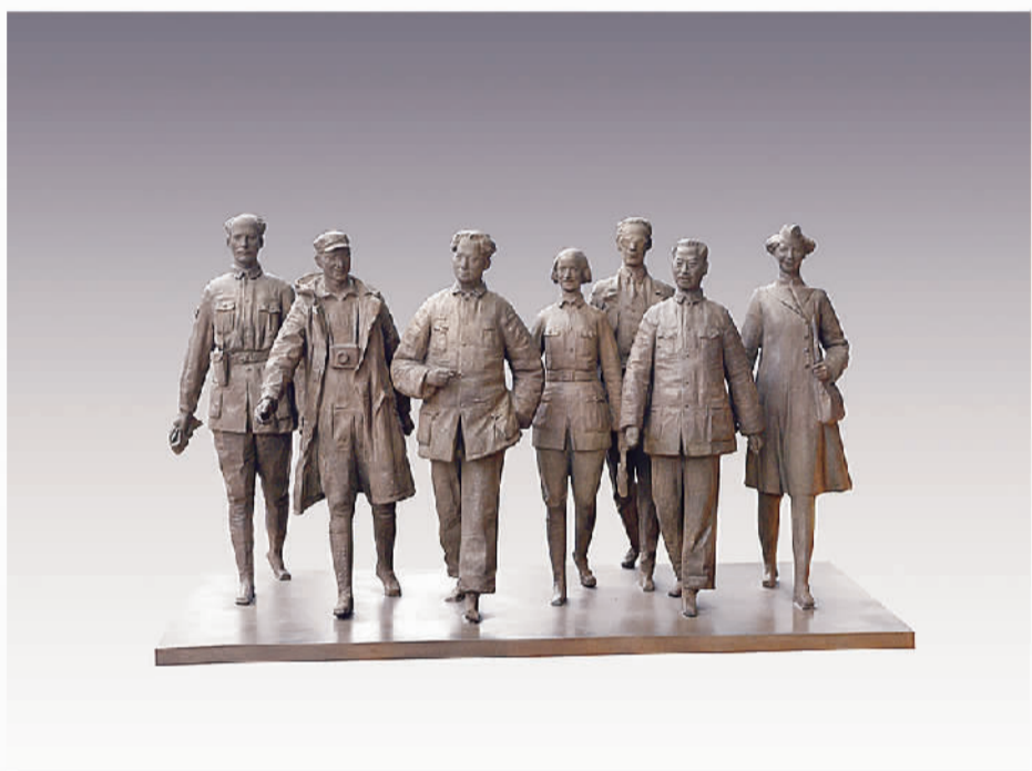
《国际友人在延安》 雕塑 王树山