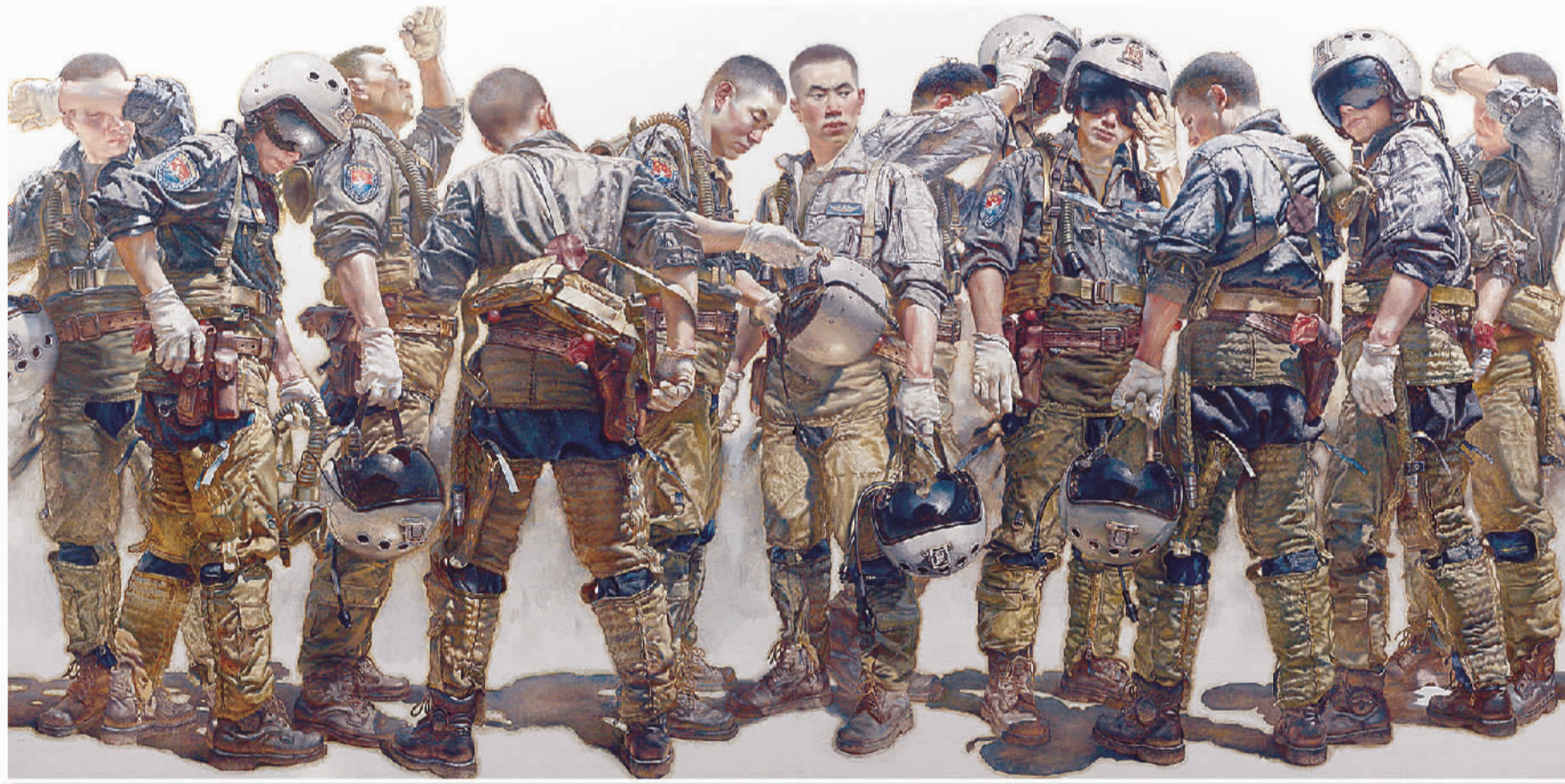
《壮志凌云·九天揽月》 油画 周长春、周末