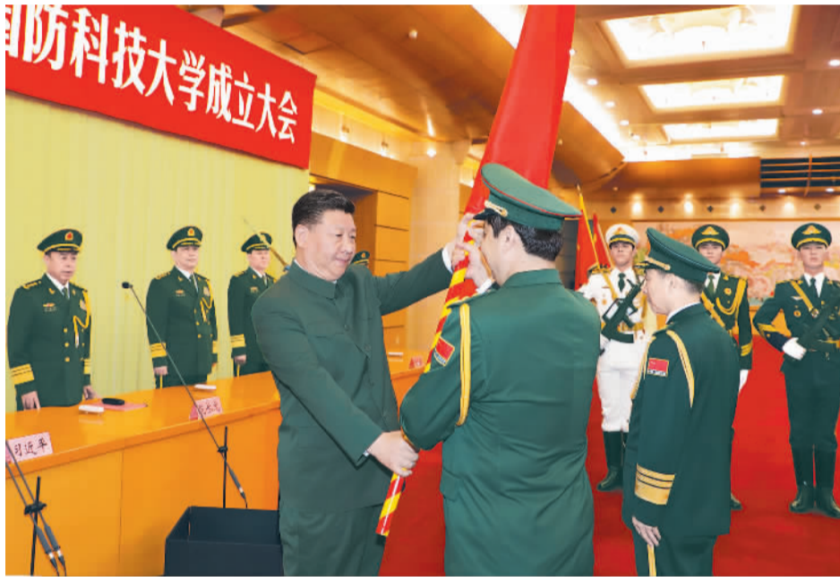
7月19日,新调整组建的军事科学院、国防大学、国防科技大学成立大会暨军队院校、科研机构、训练机构主要领导座谈会在北京八一大楼举行。中共中央总书记、国家主席、中央军委主席习近平向军事科学院、国防大学、国防科技大学授军旗、致训词。