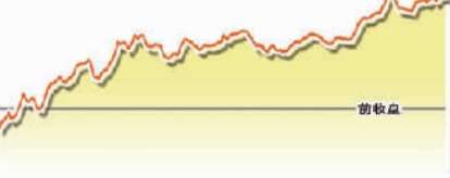
7月19日上证综指走势图