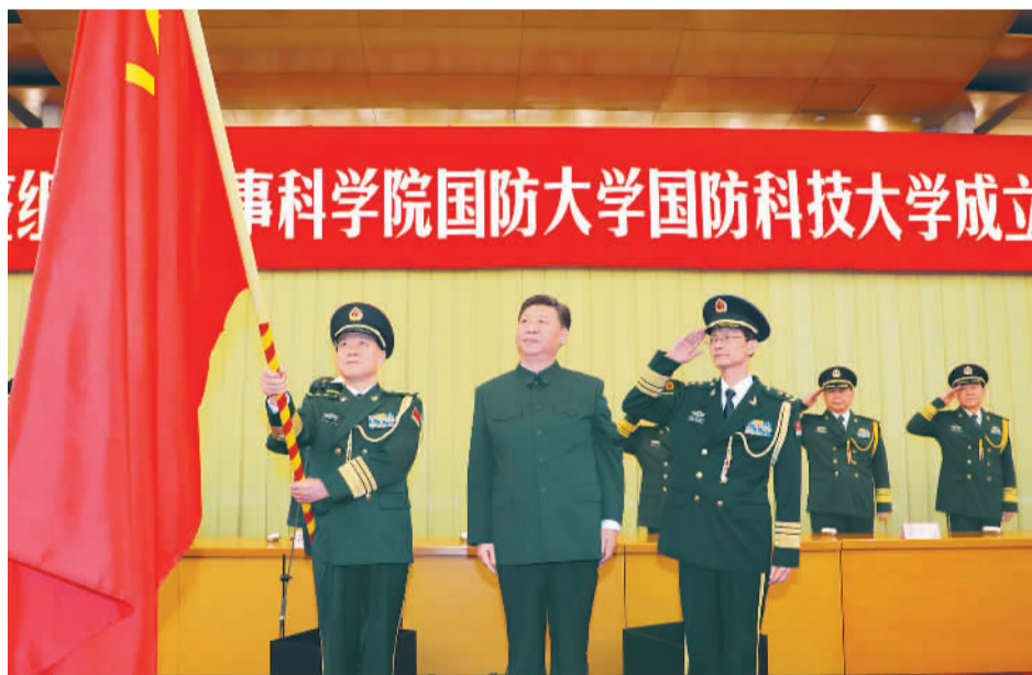
7月19日,新调整组建的军事科学院、国防大学、国防科技大学成立大会暨军队院校、科研机构、训练机构主要领导座谈会在北京八一大楼举行。中共中央总书记、国家主席、中央军委主席习近平向军事科学院、国防大学、国防科技大学授军旗、致训词,出席座谈会并发表重要讲话。