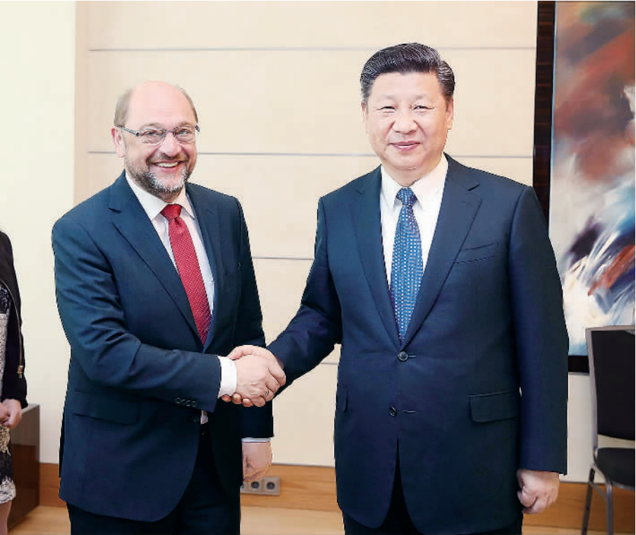
7月6日，国家主席习近平在柏林会见德国社会民主党主席舒尔茨。