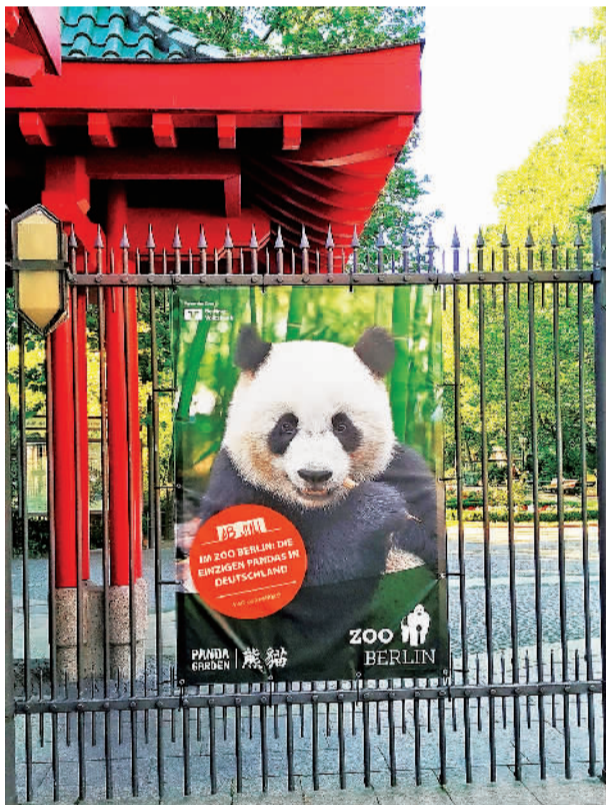
柏林动物园贴出的大熊猫海报。