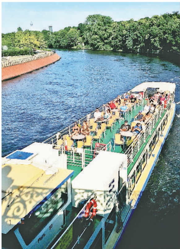
柏林施普雷河上的游船。