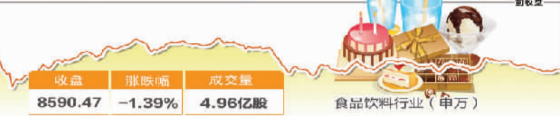
7月4日波动最大行业走势图