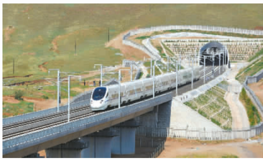
△6月29日起,内蒙古首条高铁——张家口至呼和浩特客运专线乌兰察布至呼和浩特东段正式进入按图行车试验阶段。

●内蒙古今年计划退出地方煤矿16处、产能810万吨,到6月底已退出煤矿14处、产能660万吨,完成年度关闭计划的80%以上。