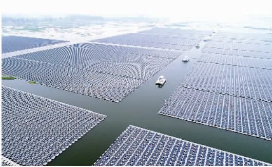
△安徽省淮南市潘集区采煤塌陷区水域上,总装机容量为40兆瓦的水上漂浮式光伏电站开始陆续并网发电。

●合肥市政府、江淮汽车与大众汽车集团三方签署投资协议,成立新的合资公司,将于2018年正式投产首款电动汽车。