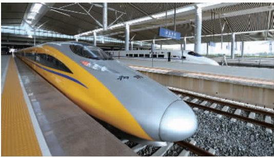
△我国首条穿越秦岭的高速铁路——西(安)成(都)高铁陕西段联调联试正式启动。

●6月21日,陕西省与中国铁建、中国中铁、葛洲坝集团举行项目投资签约仪式,合作建设高速公路。