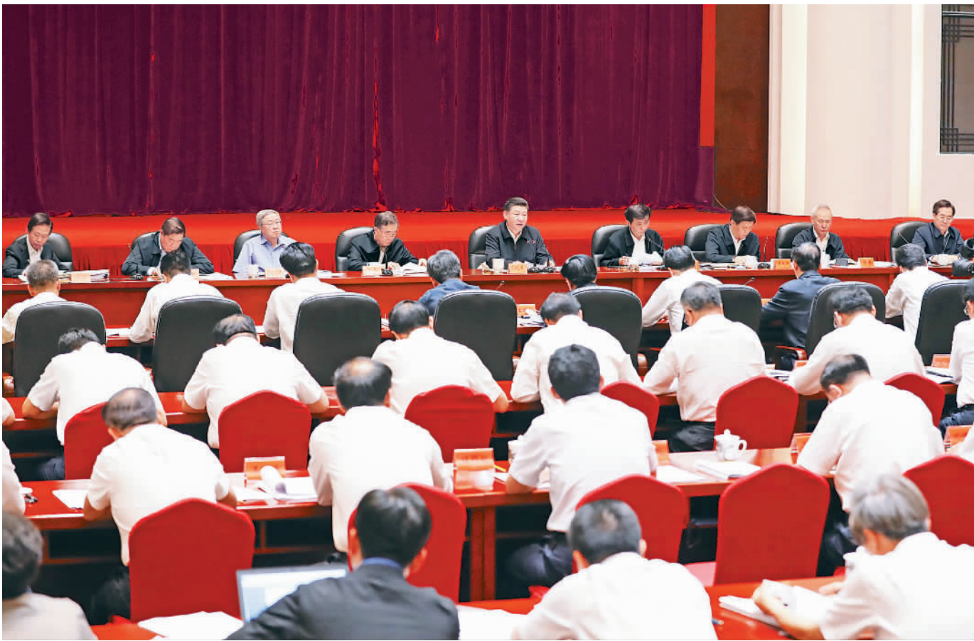
6月23日,中共中央总书记、国家主席、中央军委主席习近平在山西太原市主持召开深度贫困地区脱贫攻坚座谈会并发表重要讲话。

然十分艰巨。现有贫困大多集中在深度贫困地区。这些地区多是革命老区、民族地区、边疆地区,基础设施和社会事业发展滞后,社会文明程度较低,生态环境脆弱,自