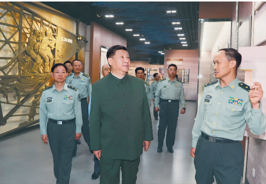
6月22日,正在山西省考察工作的中共中央总书记、国家主席、中央军委主席习近平来到驻晋部队某基地视察调研。这是习近平视察基地军史馆。