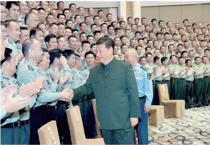
6月22日,正在山西省考察工作的中共中央总书记、国家主席、中央军委主席习近平在太原接见驻晋部队师以上领导干部和建团单位主官。

仲夏时节,晋西北大地草木葱绿、生机盎然。上午9时许,习近平驱车来到基地军史馆。该基地创建于上世纪60年代,是我国首个自主设计建造的重点国防