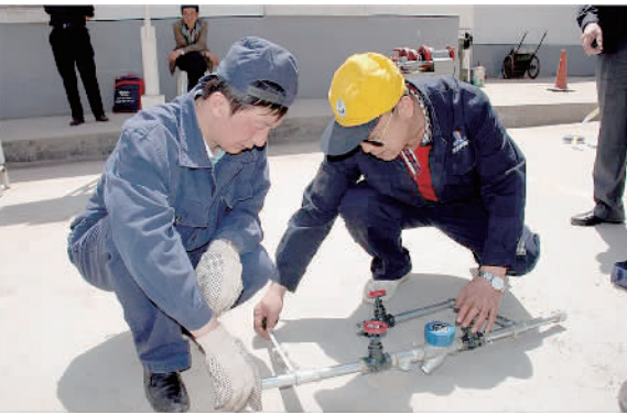
房建职工在举行配管安装比赛。