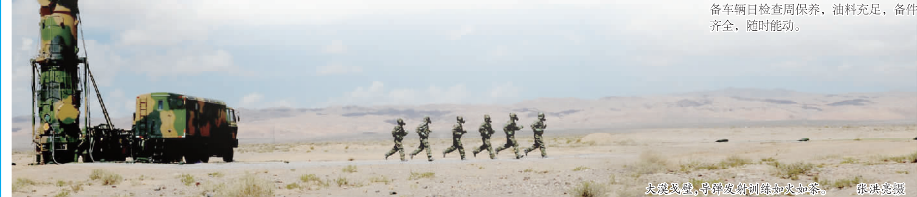
大漠戈壁，导弹发射训练如火如荼。

每月连队组织队列会操，尹东不仅要求看队列动作、排面呼号，还加入提问动作要领、抽点讲解示范等内容。从战备拉动演练、军事技术比武到基础体能训练专攻精练，这样的“折腾”连队官兵习以为常。 这几年，连队常态保持着按战备要求储备物资，排列有序，一装就走；就寝后衣物全部按顺序规整叠放，上铺鞋尖朝里、下铺鞋尖朝外，提脚就穿；装备车辆日检查周保养，油料充足，备件齐全，随时能动。