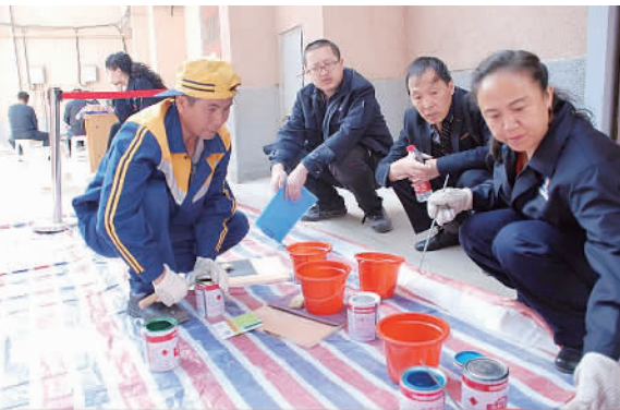
兰铁兰州房建段职工在进行调漆配色比赛。

说起铁路工作人员，不少人首先想到的是青春靓丽的“高哥”“高姐”，然而在铁路工作者中，还有一个工种——铁路房建工，他们整天与泥土油污、钢筋管道、焊枪漆刷打交道，攀上爬下，修修补补，为列车运行提供安全保障，为旅客提供舒适的乘车环境。 兰州铁路局兰州房建段职工面对宝兰客专联调联试期间繁重的任务，以“一毫米不差，差一毫米不行”的标准落实轨道测量作业，为宝兰客专早日顺利通车，默默奉献着自己的力量。 本报记者 李琛奇 通讯员 查莉摄影报道