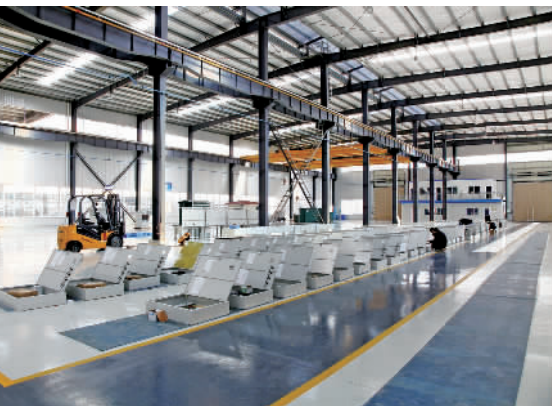
图为湖南（邵东）德沃普电器有限公司的智能变压器生产线。

打火机只是企业主动转型升级的一个缩影，在服饰行业，智能吊挂系统可引导各流水线上的工人精准加工；在五金工具生产中，自动化设备开始代替铁锤打……转型升级，使邵东工商业发展具备了更为深厚的基础，也发展了自主品牌。智能变压器、工业蓄电池、工业缝纫机、机车配件等一系列“邵东智造”产品纷纷走向世界。