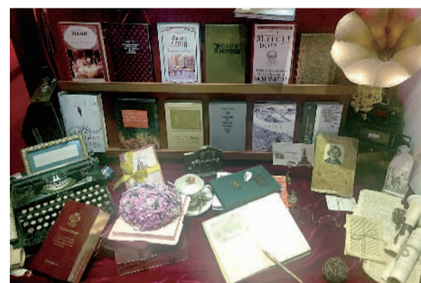
果戈里书店的橱窗极富异域风情。

在数字化阅读的时代，激起人们回归有温度、有深度的纸质阅读，这是果戈里书店所信奉的理念