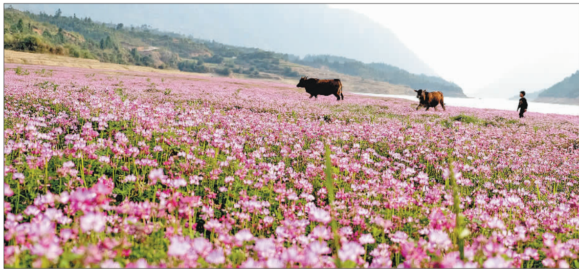
花海牧歌 ▲摄于江西上饶县茗洋湖紫云英花海。