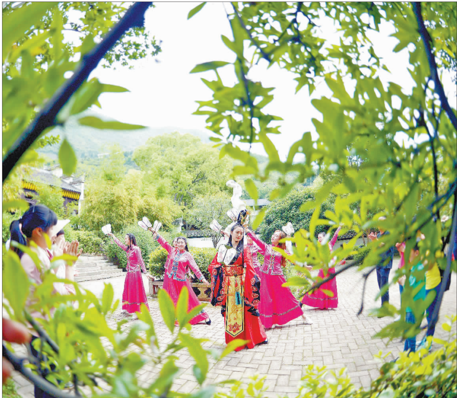
夏舞昭君 ▲摄于湖北宜昌兴山县昭君古汉文化游览区。