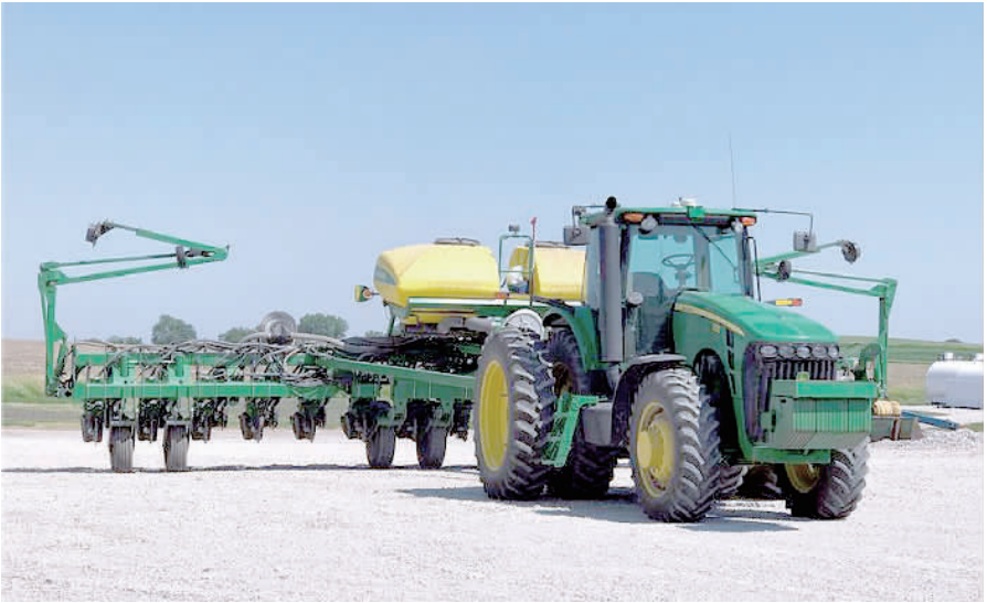
金伯利农场里的大型农业播种机。