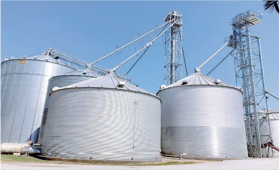
金伯利农场里的粮食烘干和储备设施。