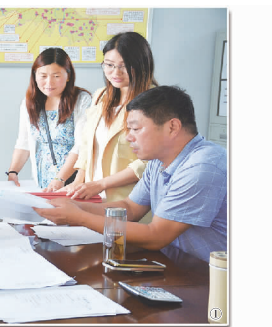
①6月7日,河南省商水县平店乡扶贫办工作人员对建档立卡贫困户信息进行审核把关。该县根据致贫原因因户制宜,积极开展产业帮扶、合作帮扶、培训帮扶、兜底帮扶。