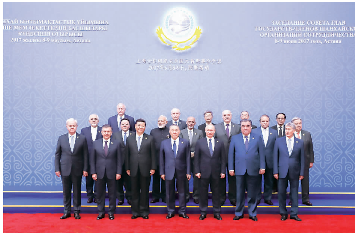
6月9日,国家主席习近平在哈萨克斯坦首都阿斯塔纳出席上海合作组织成员国元首理事会第十七次会议并发表重要讲话。这是大范围会议开始前,出席会议的各国领导人以及国际和地区组织负责人、代表等集体合影。