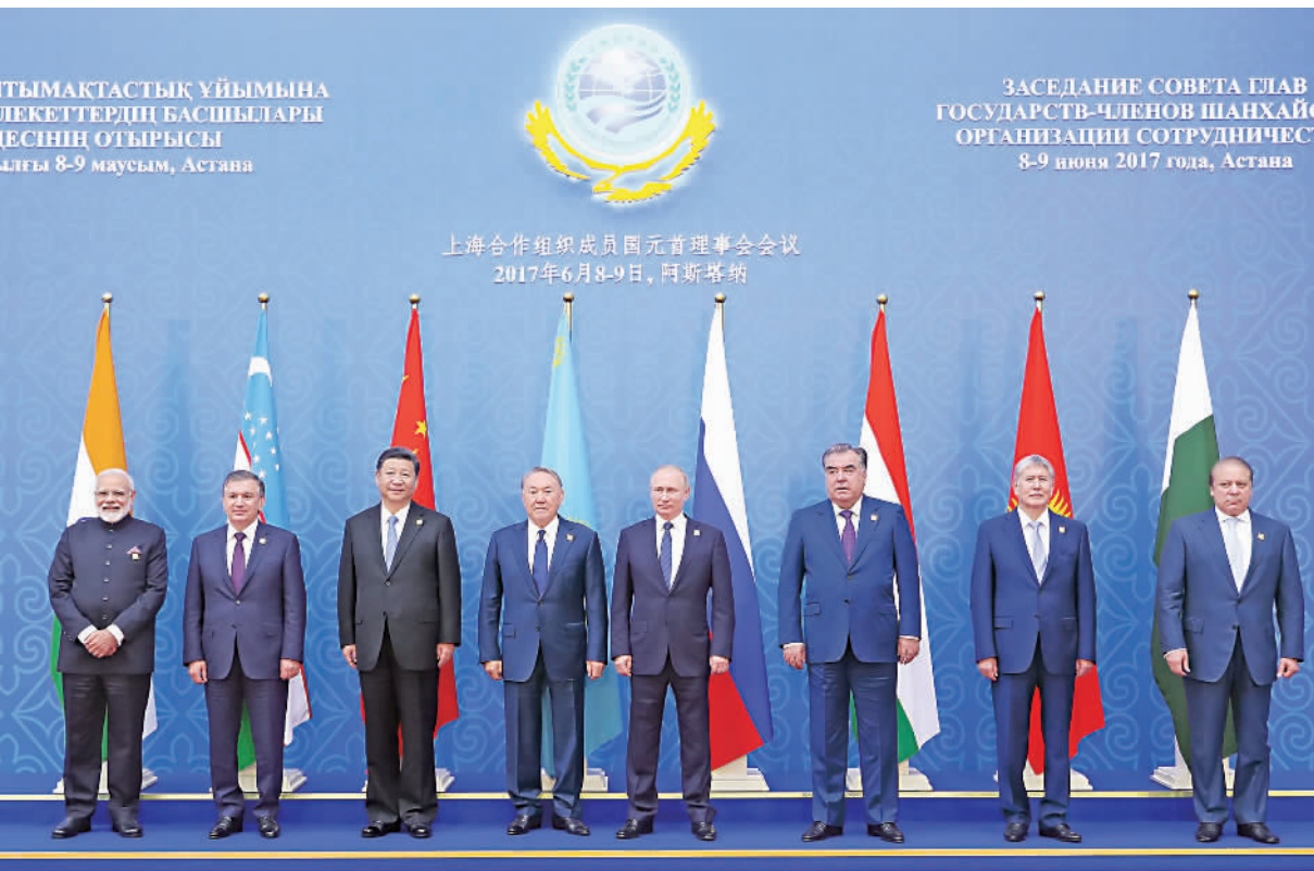
6月9日,上海合作组织成员国元首理事会第十七次会议在哈萨克斯坦首都阿斯塔纳举行。会议正式给予印度、巴基斯坦上海合作组织成员国地位。这是国家主席习近平同其他成员国元首、印度总理、巴基斯坦总理集体合影。