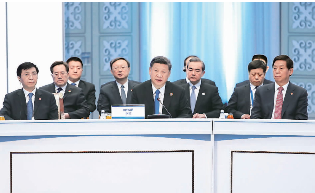
6月9日,国家主席习近平在哈萨克斯坦首都阿斯塔纳出席上海合作组织成员国元首理事会第十七次会议并发表重要讲话。