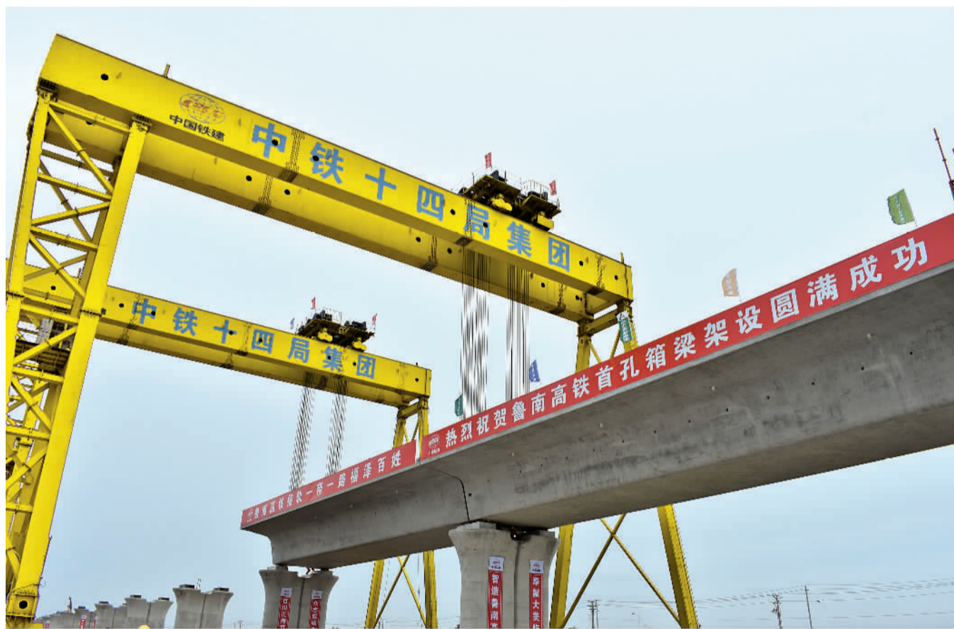
6月5日,鲁南高铁临沂北特大桥首片箱梁架设成功,比计划工期提前一个月。

据悉,鲁南高铁项目由山东省主导投资建设,山东高速集团控股的山东铁投公司为主投资,项目全长494公里,是山东省境内建设里程最长、投资规模最大、覆盖人口最多的铁路项目。作为以山东省为主投资建设的铁路投融资改革试点项目,鲁南高铁采用“长期股权和类PPP”模式,由大型央企投资入股。目前,在临沂至曲阜项目中已与中铁建集团等企业实现PPP合作合作,引进社会资本30亿元,实现了投资主体多元化。