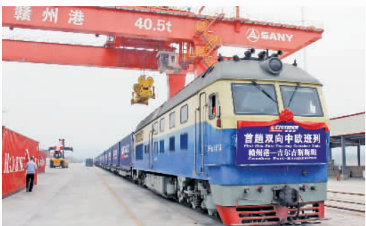
△6月1日，江西赣州首趟中欧双向班列(俄罗斯—赣州港—吉尔吉斯斯坦)发车。

● 江西省下发《关于促进实体零售创新转型的实施意见》，从不断优化商业结构、大力引导创新转型、促进融合发展等方面提出6项具体措施。