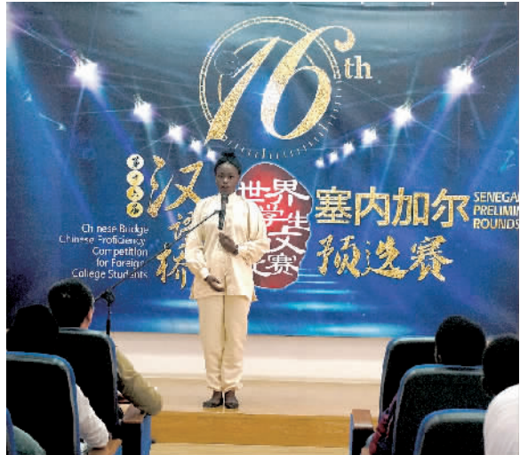
塞内加尔的选手在演讲。

很多外国学员来说，确实是不小的挑战。但是随着孔子学院在世界各地遍地开花，学习汉语已不再是一种曲高和寡的探索，而成为越来越多外国青年的优先选择。俗话说，天道酬勤。有孔子学院越来越完善的教学设施，有老师和志愿者们们的共同努力，相信会有越来越多的学员体会到中文的精髓和魅力。