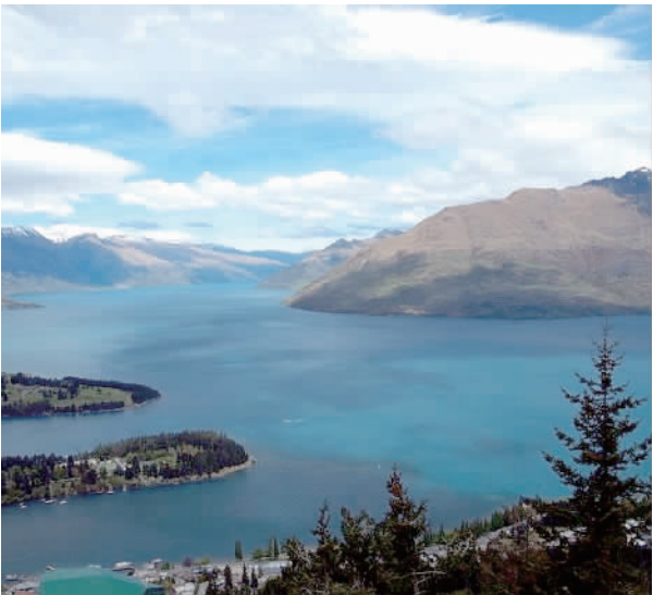
新西兰皇后镇的美丽景色。

奥马鲁政府不仅在它们经常出入的地方修建了提示牌，提醒来往车辆，还专门为这些小家伙修建了一条地下通道。 皇后镇在你眼里是心跳加速，湛蓝静谧；走曲折的山路去看静止的萤火虫，沉下心细首等待回家的蓝企鹅……在新西兰，所有震撼都来自于发现自然的本来魅力。 奥马鲁政府不仅在它们经常出入的地方修建了提示牌，提醒来往车辆，还专门为这些小家伙修建了一条地下通道。 皇后镇在你眼里是心跳加速，湛蓝静谧；走曲折的山路去看静止的萤火虫，沉下心细首等待回家的蓝企鹅……在新西兰，所有震撼都来自于发现自然的本来魅力。