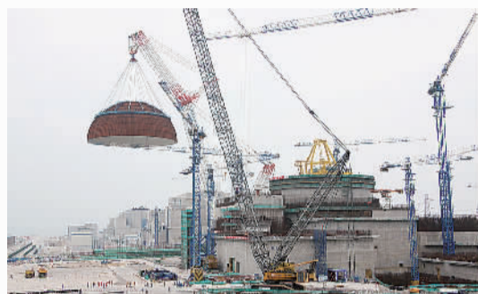
△我国自主三代核电“华龙一号”全球首堆示范工程——中核集团福清核电5号机组穹顶吊装成功。

●5月23日，福建省政府确定出台实施《福建省农村扶贫开发办法》，进一步推动全省扶贫开发规范化、法制化、长效化。