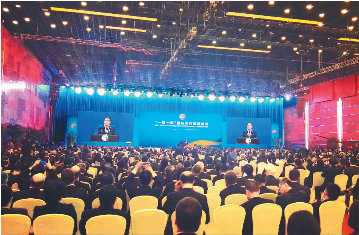
在5月14日举办的“一带一路”国际合作高峰论坛高级别全体会议上，希腊总理齐普拉斯向与会嘉宾讲述希腊的“一带一路”故事。

济和能源部长齐普里斯说，“一带一路”倡议推动亚欧基础设施实现互联互通，从而更好地促进亚欧贸易和投资。