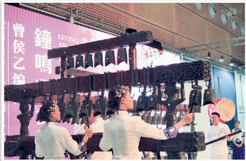
在第十三届文博会上,曾侯乙编钟暨中国古代青铜文明移动博物馆进行现场展演。

综合性文化企业,主要业务包括图书、报刊、电子音像和数字网络出版、出版物印制发行、出版物资贸易和文化投资等,拥有27家全资和控股子公司,员工近万人。近年来,集团公司深入贯彻落实中央和河北省委、省政府关于加快文化体制改革和文化产业发展的战略部署,集团公司积极推进体制改革和机制创新,大力实施内部资源整合和外部战略重组,全面推动产业升级和项目建设,产业发展呈现强劲上扬的良好态势,主要经济指标连续五年高速增长。2012年总体经济规模居全国同行业第八位,被评为全国文化体制改革先进单位。2013年集团公司销售收入、资产总额分别达到109.95亿元、110.35亿元,提前两年实现了“双百亿”战略目标,成为河北首家“双百亿”文化企业。