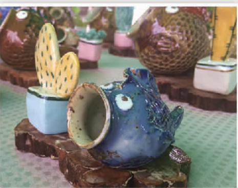
在大芬油画村分会场创意市集上,各种精巧的文创产品备受关注。