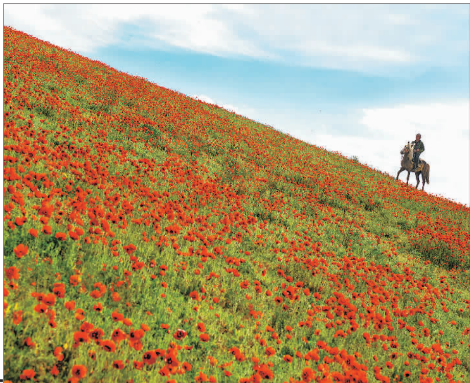
▲新疆伊犁河谷天山北坡花海美景。