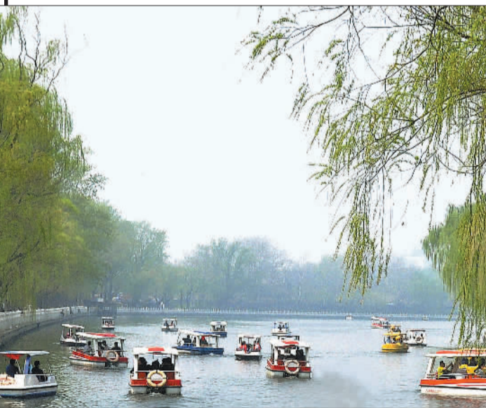
▲北京什刹海春意盎然，来自全国各地的游客踏青赏景。