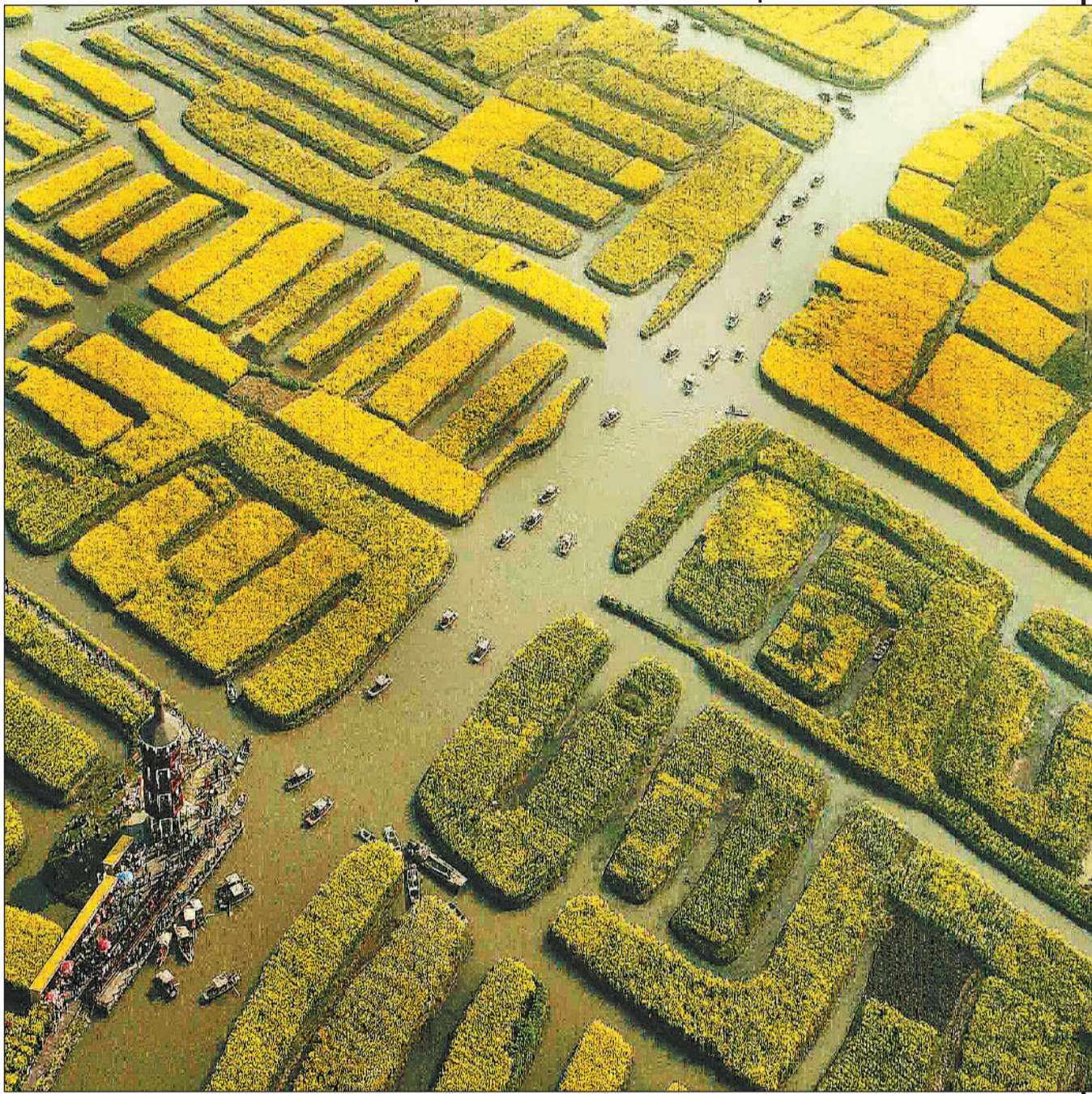
▼江苏兴化千垛菜花风景区河如阡陌景正美。