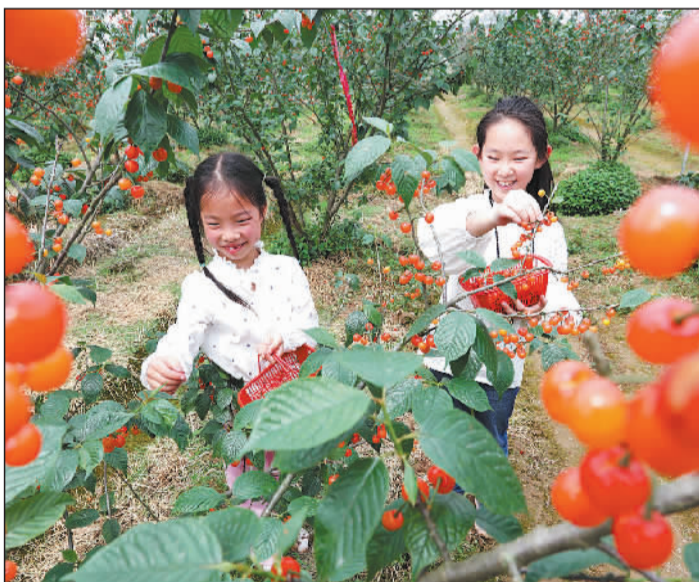
▲江西抚州市东乡区花果山生态园，小朋友快乐采摘。