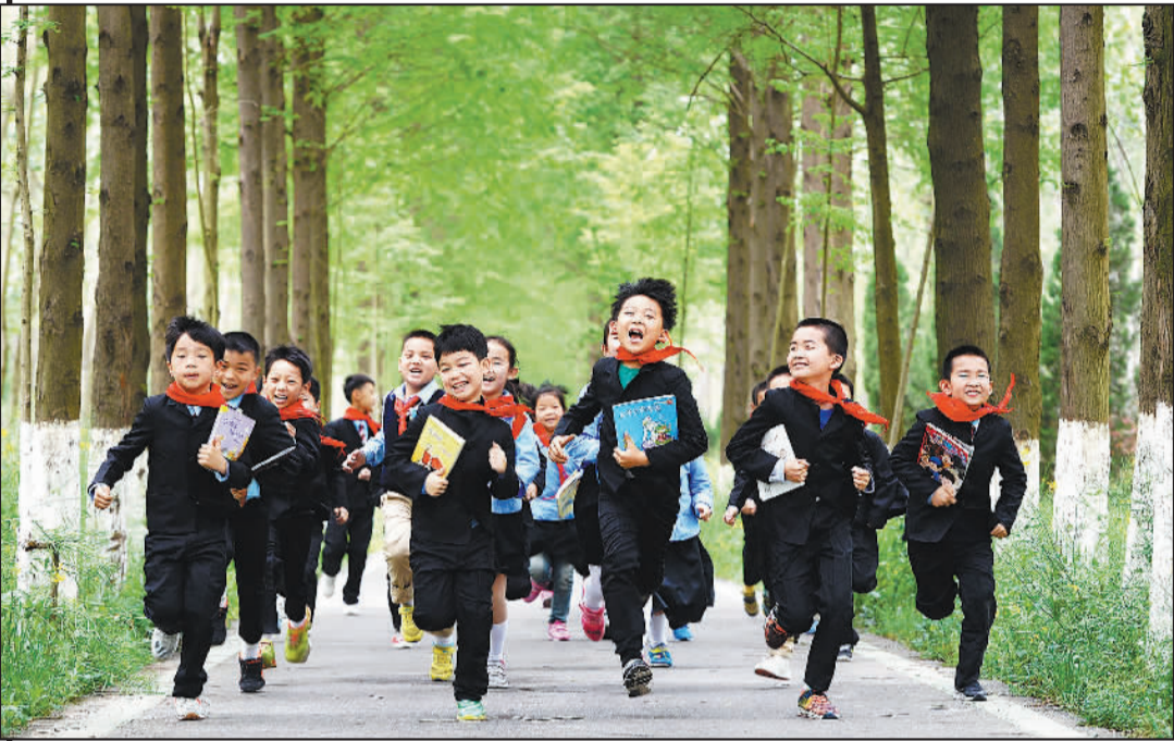
▲安徽合肥滨湖国家森林公园，孩子们在春日奔跑。