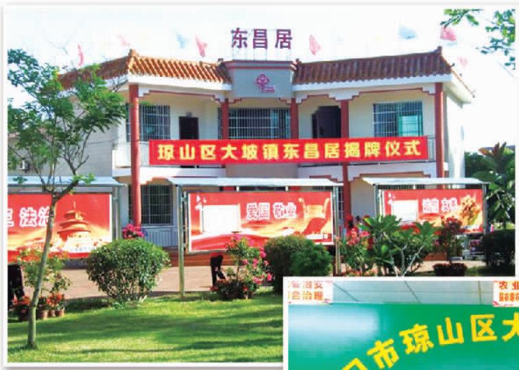
右图 东昌居综合服务平台。

“只有推进农场办社会职能改革,逐步将办社会职能所需开支纳入政府公共财政保障范围并实行社会职能统一管理,才能使国有农场真正瘦身强体,有效降低经营成本;才能使国有农场集中精力和资源一心一意发展主业,提高国有资本运营质量和效益,提升企业核心竞争力。”农业部党组成员杨绍品告诉记者,国家从2016年起,将用3年左右时间,将国有农场承担的社会管理和公共服务职能纳入地方政府统一管理。