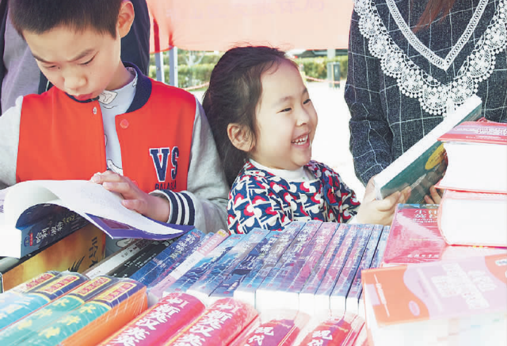
4月22日,安徽马鞍山市花山区举办读书节暨惠民图书展及期刊免费赠阅活动,纪念“世界读书日”的到来。活动为群众提供新版图书和畅销图书5折优惠展销,同时精选300册期刊,现场赠送给读者,将文化惠民服务送到群众手中。