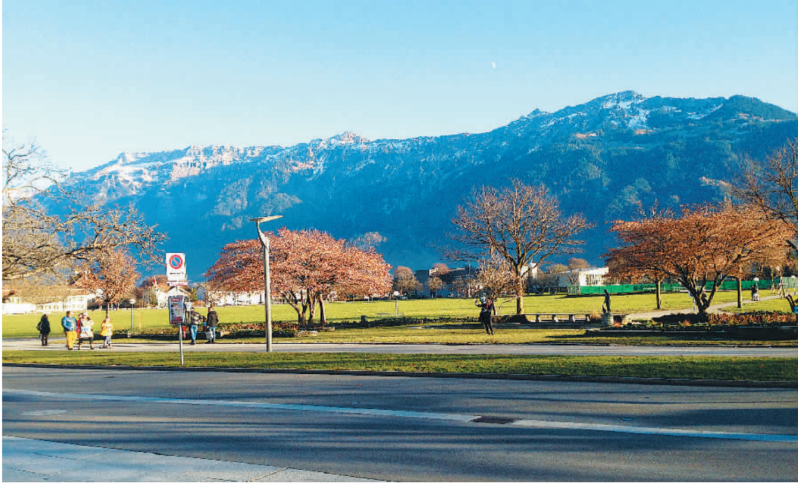
瑞士因特拉肯小镇风光。

笔者到瑞士作了一番短暂的旅行。虽然仅仅是浮光掠影地走过,但也感到瑞士这个“小而美”的国家引人入胜。这样的感受,可以从几个“关键词”说起。“欧洲屋脊”与“世界公园”。瑞士地形地貌以山地为主,有“欧洲屋脊”之称。从南边的意大利乘大巴,越靠近两国边境,山也越来越高,与笔者熟悉的“蜀道难”差不了多少。流动的都是风景,大巴穿行在阿尔卑斯山狭窄的盘山公路上,远处的皑皑白雪举目可见,俯视则是湖泊和森林,不但不觉得惊险,反而心旷神怡。近现代以来,瑞士并没有依赖传统发展模式,成为周边发达国家的产业转移承接地,而是另辟蹊径,利用丰富的旅游资源大力发展旅游业。滑雪、爬山、休闲……好风光吸引许多人到此观光,当地还非常注意保持生态平衡、