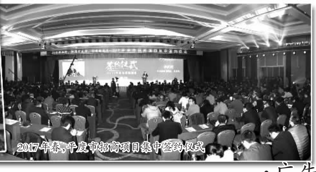
2017年春,平度市招商项目集中签约仪式