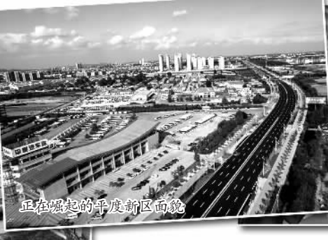
正在崛起的平度新区面貌