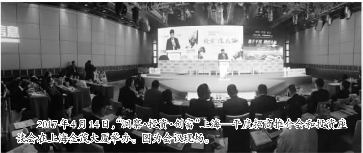
2017年4月14日,“洞察·投资·创富”上海—平度招商推介会和投资座谈会在上海金茂大厦举办。图为会议现场。

打造新面貌,夺取新成效,创造新高度。平度市紧紧跟进国际国内资本流动大趋势,以招商引资促进经济发展转型升级,正在加快建设青岛北部崛起的现代化区域性中心城市。