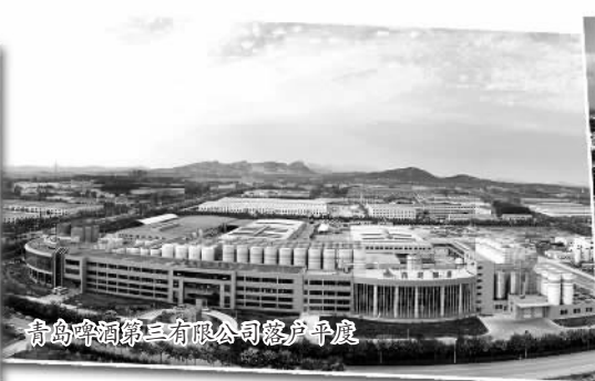
青岛啤酒第三有限公司落户平度