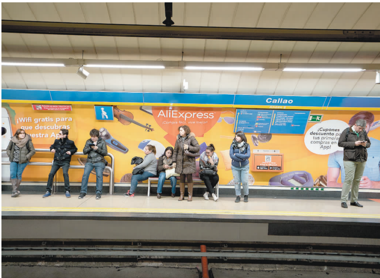
跨境电商平台正在各国形成自己的品牌。图为西班牙地铁站中的速卖通广告。

海外消费者热衷网购的品类也值得玩味,手机通讯、服装及配饰、消费电子、美容健康等品类成为热门颇为自然,在中国电商发展的初期,这些品类同样支撑着半壁江山。但是,家居园艺、汽车配件、假发等品类也同成为“海淘”出口