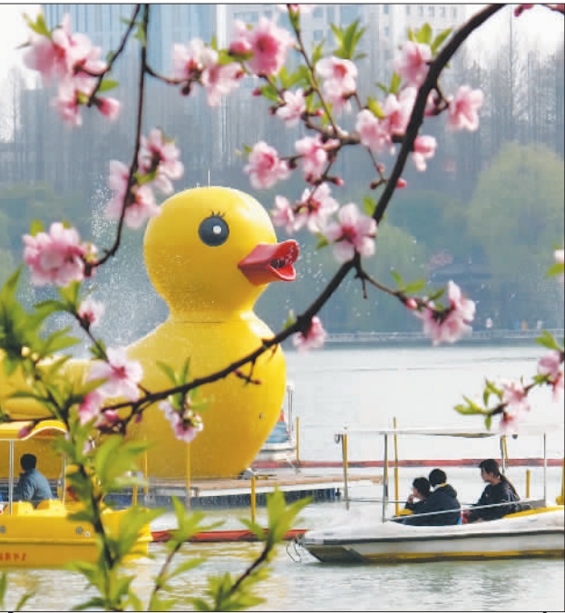
春日游园 ▲摄于江苏南京玄武湖公园。