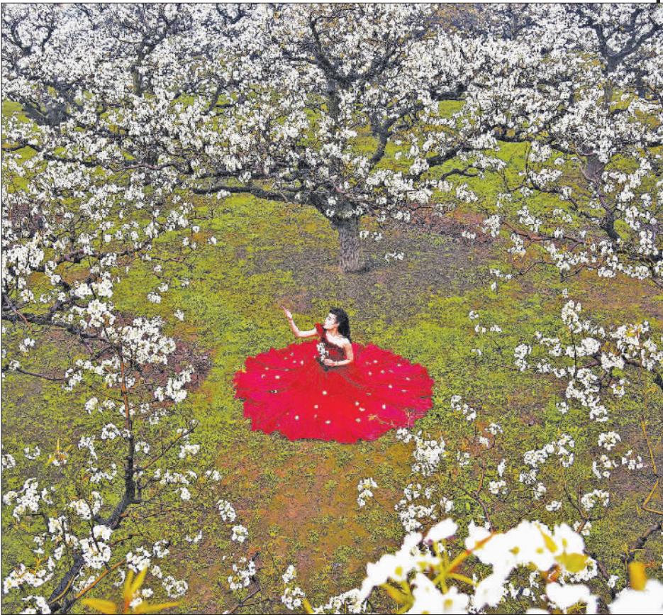
春到校园 ▲摄于重庆市大学城。 梨园春景 ▲摄于安徽砀山县梨园。