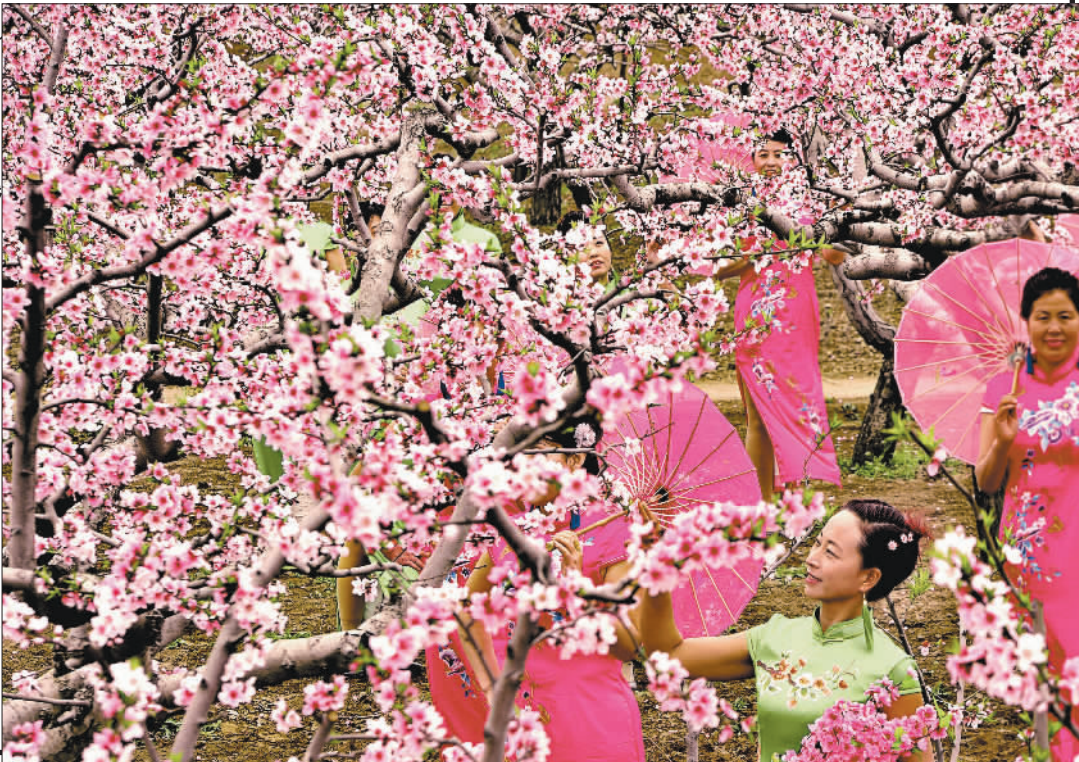
苗木基地 桃园 。