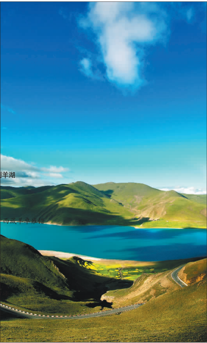
春到羊湖 ►摄于西藏羊卓雍措。