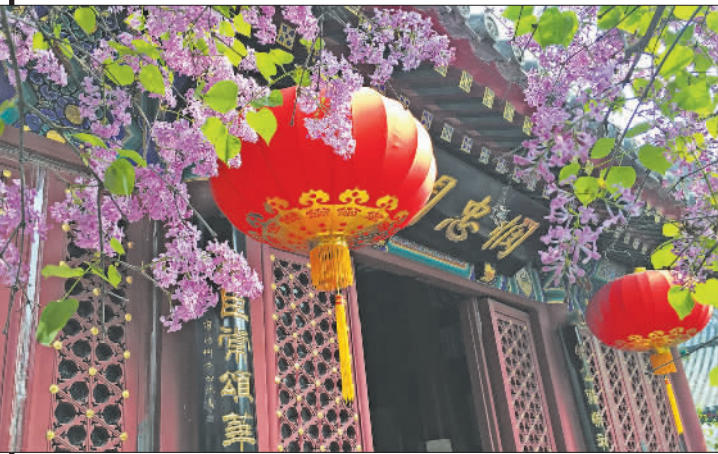
暗香疏影 ▲摄于北京市西城区法源寺。