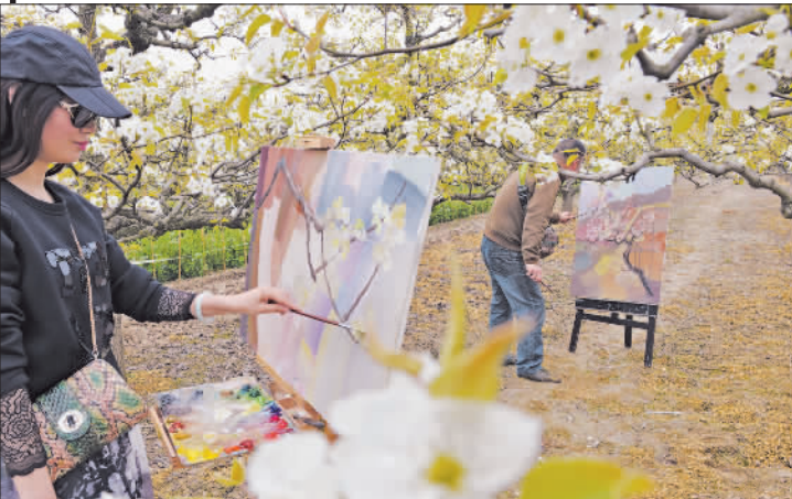
桃园写生 ▼摄于江苏宿迁市宿城区王官集镇。