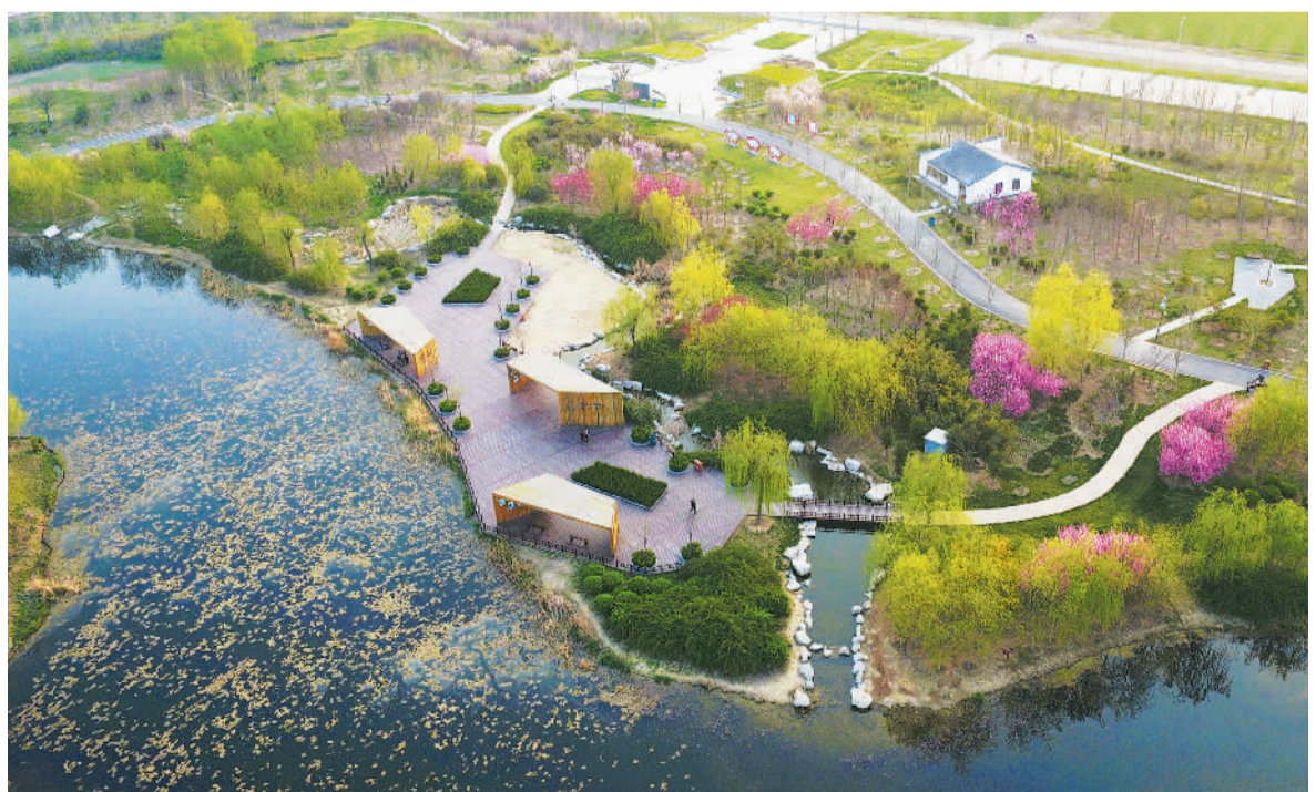
4月6日,山东邹平县韩店镇禾河湿地公园一派生机盎然的春天景色。禾河湿地公园是用附近污水处理厂净化后的达标排放水作为水源建起来的市民公园,开放2年来,已成为当地科普教育、休闲娱乐的重要场所,受到广大市民的欢迎。

据悉,“疆电外送”通道项目昌吉(准东)—古泉(华东)±1100千伏特高压直流输电工程,全长约3319公里,是目前世界上电压等级最高、输送容量最大、送电距离最远、技术水平最先进的高压直流输电工程。其配套电源项目总投资约500亿元,预计2018年年底建成。