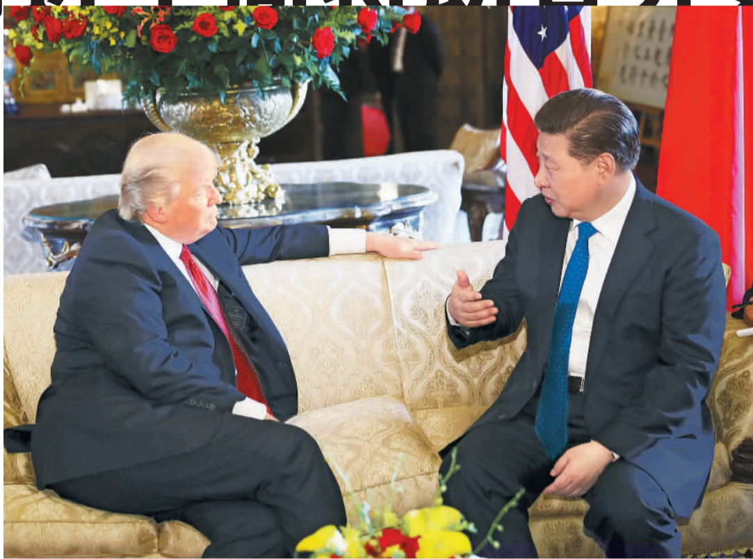
当地时间4月6日,国家主席习近平在美国佛罗里达州海湖庄园同美国总统特朗普举行中美元首会晤。