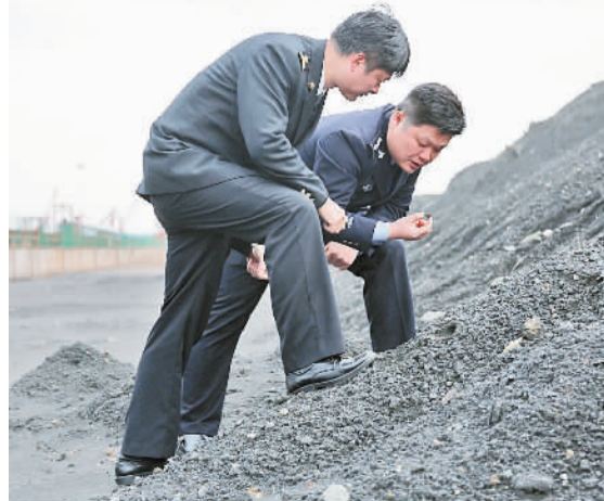
图为南京海关官员和缉私警察在靖江码头查看铁精粉。

据悉,目前这批固体废物仍存放在靖江码头,南京海关正协调承运人、收货人,尽快将其退运出境,为切实筑牢国家生态安全屏障、保护人民群众切身利益作出贡献。