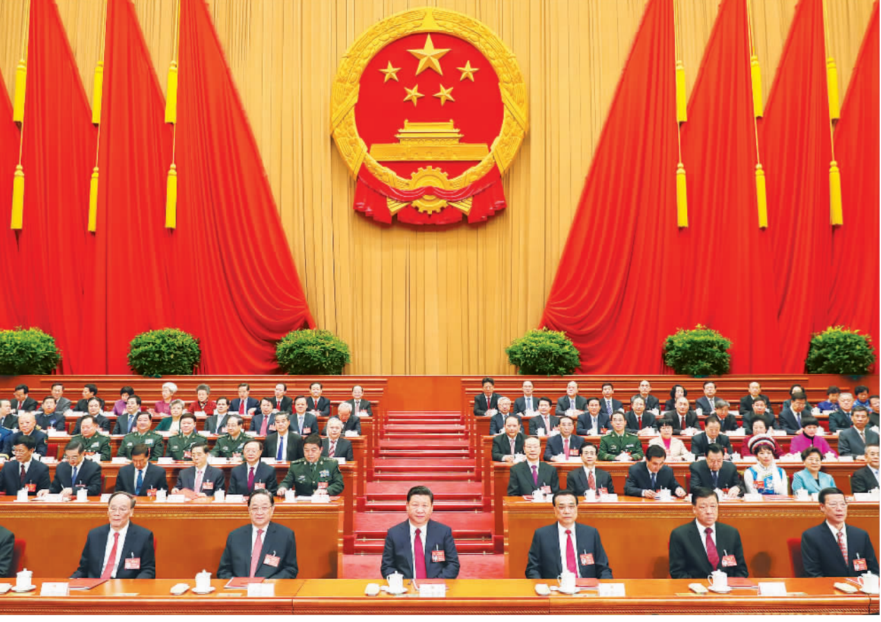
3月15日,十二届全国人大五次会议在北京人民大会堂闭幕。习近平、李克强、俞正声、刘云山、王岐山、张高丽等党和国家领导人在主席台就座。

习近平李克强俞正声刘云山王岐山张高丽等在主席台就座 张德江主持 批准政府工作报告、全国人大常委会工作报告等 通过民法总则 习近平签署主席令予以公布 表决通过关于十三届全国人大代表名额和选举问题的决定等法律文件