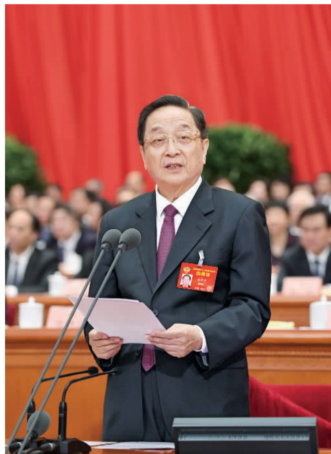
3月13日,全国政协十二届五次会议在北京人民大会堂举行闭幕会。全国政协主席俞正声主持闭幕会并讲话。