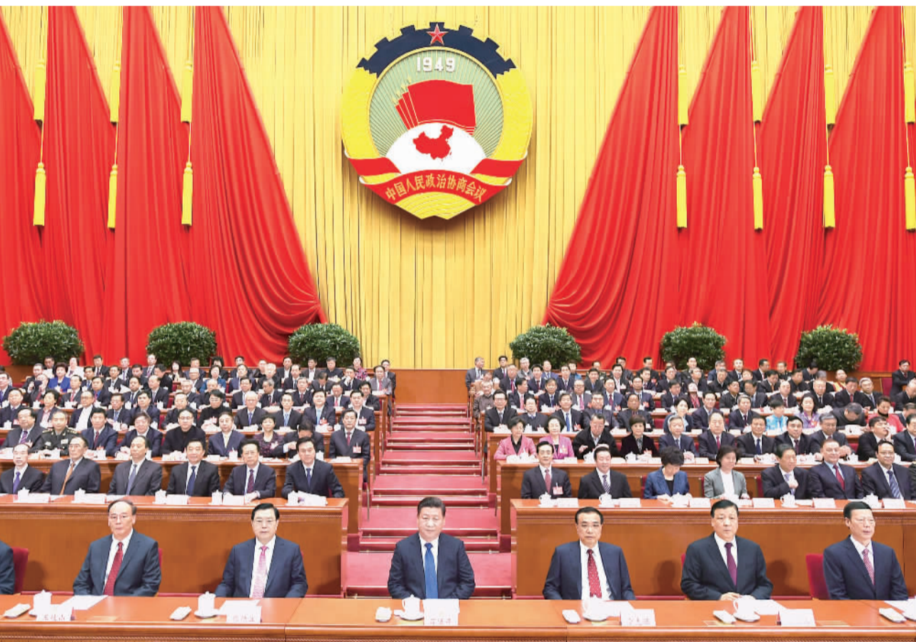
3月13日,中国人民政治协商会议第十二届全国委员会第五次会议在北京闭幕。这是习近平、李克强、张德江、刘云山、王岐山、张高丽等在主席台就座。