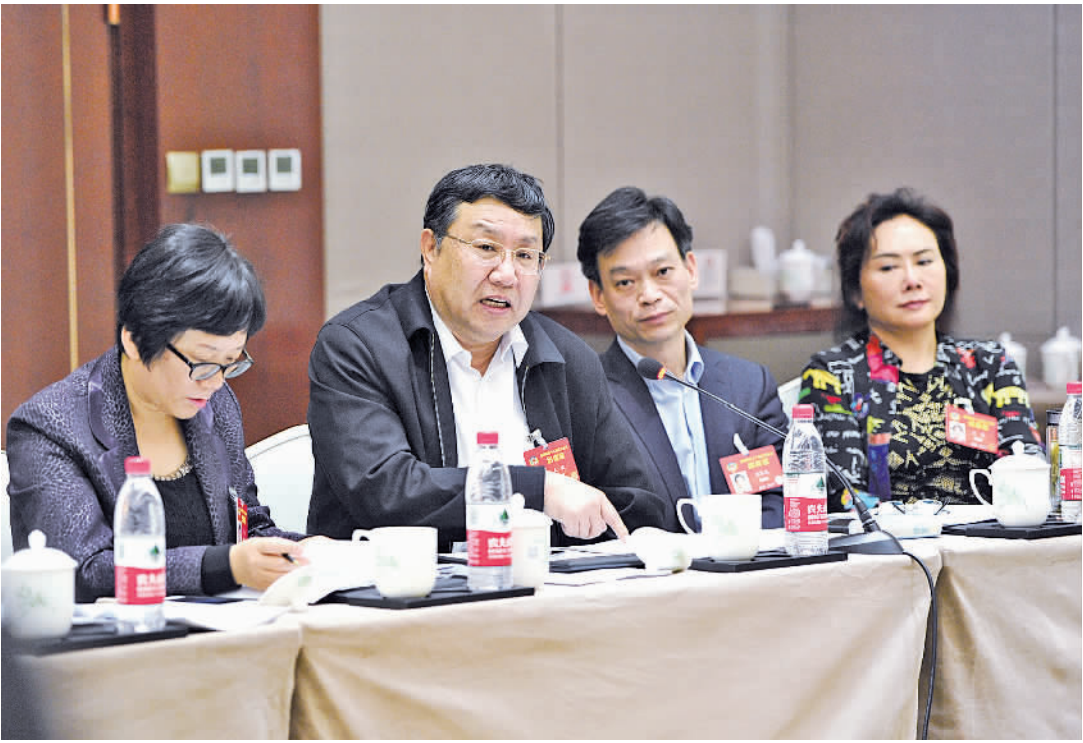
全国政协委员王欣(左二)在全国政协民建界别举行的小组会议上提出,国家大力推进减税降费,给企业带来更多动力。

“我国宏观税负近年来呈现稳中有降态势,特别是一系列减税降费措施的陆续出台,企业税负大大减轻。”国家税务总局