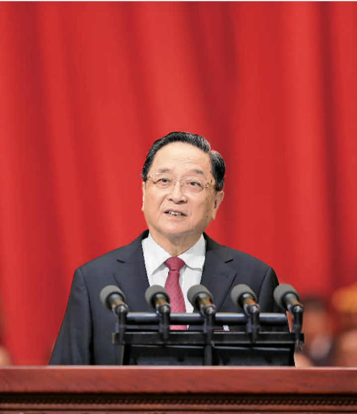
3月3日,中国人民政治协商会议第十二届全国委员会第五次会议在北京人民大会堂开幕。这是俞正声代表政协第十二届全国委员会常务委员会作工作报告。