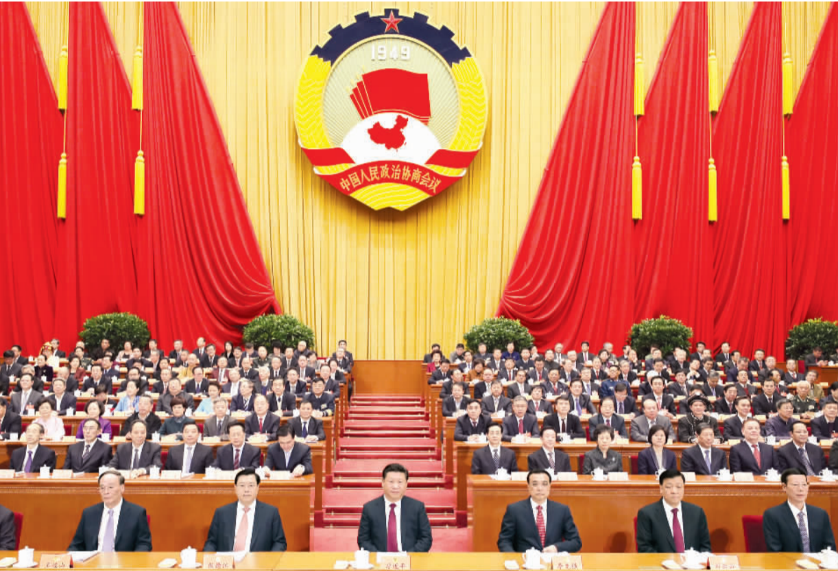
3月3日,中国人民政治协商会议第十二届全国委员会第五次会议在北京人民大会堂开幕。这是习近平、李克强、张德江、刘云山、王岐山、张高丽在主席台就座。