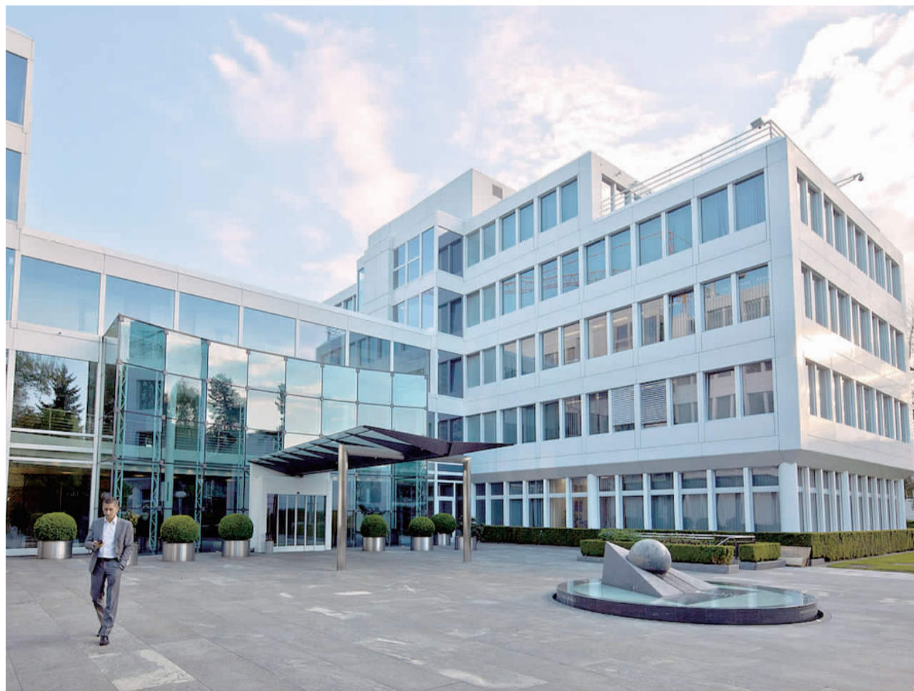
图为位于瑞士山区小州楚格的全球最大大宗商品交易商嘉能可公司全球总部大楼。