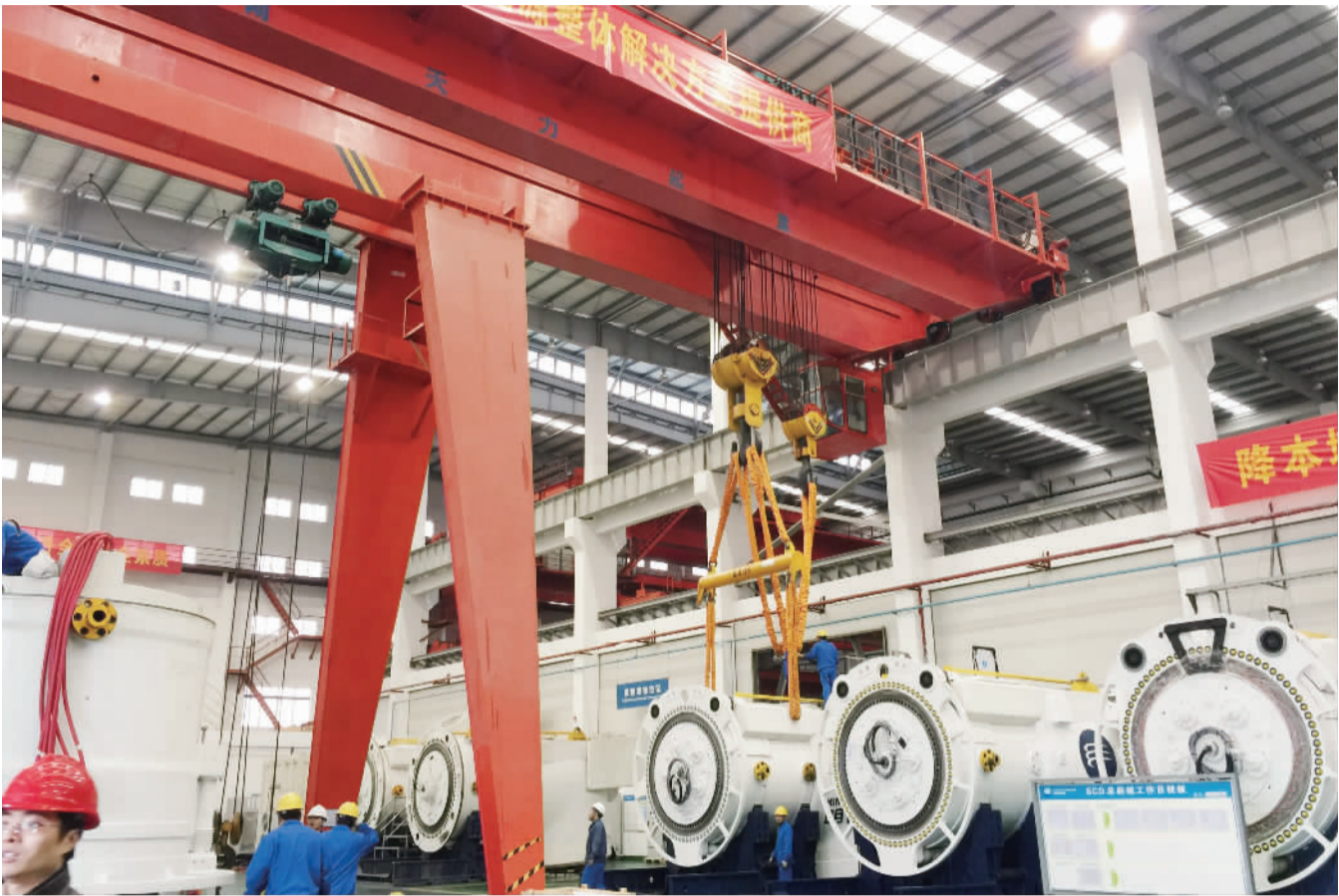
广东佛山明阳风电总装车间,工人们在装配风力发电机组。在银行债委会的帮助下,该公司加紧去产能,化解资金风险,研发出具有自主知识产权的1.5MW风机系列,实现“两高一低”的目标(即高发电量、高利用率、低度电成本)。

1月中旬,《经济日报》记者跟随中国银监会一行走访山东、江苏、浙江、江西、广东5个省份。在围绕供给侧结构性改革展开实地调研时发现,债委会不仅在企业去产能、去库存方面发挥化解风险的作用,也在促进企业提质增效、转型升级等方面卓有成效,在“去”“补”间推进行业形成合力,助力我国经济平稳健康发展。