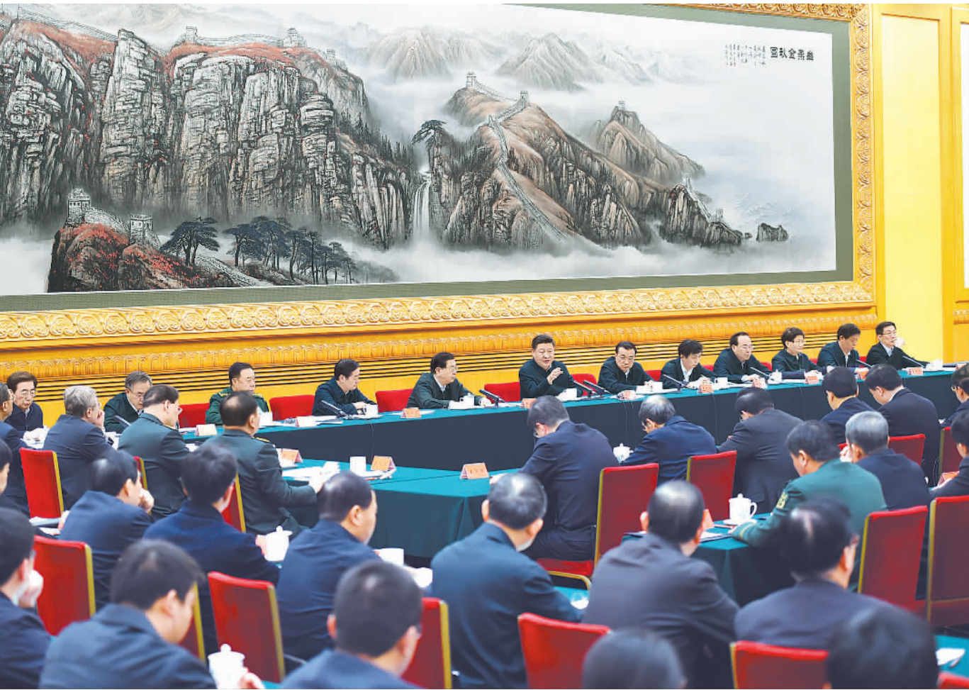
2月17日,中共中央总书记、国家主席、中央军委主席、中央国家安全委员会主席习近平在北京主持召开国家安全工作座谈会并发表重要讲话。

习近平强调,认清国家安全形势,维护国家安全,要立足国际秩序大变局来把握规律,立足防范风险的大前提来统筹,立足我国发展重要战略机遇期大背景来谋划。世界多极化、经济全球化、国际关系民主化的大方向没有改变,要引导国际社会共同塑造更加公正合理的国际新秩序。