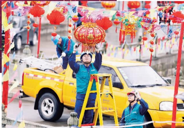
下图 2月11日,浙江奉化供电公司工作人员在对彩灯进行维护,助阵元宵庙会。奉化古镇溪口萧王庙元宵庙会当地规模最大的庙会之一,期间为广大市民举行舞龙、戏曲、舞蹈等多种传统民俗表演。