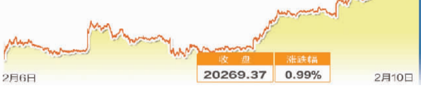
道琼斯工业指数一周走势图