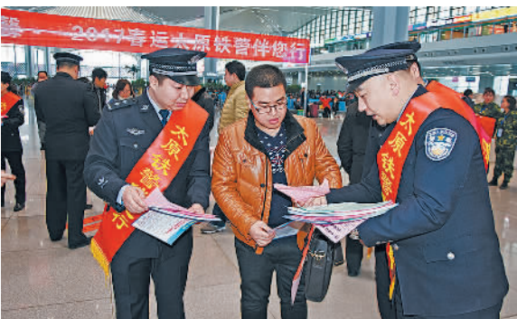
2月7日，太原南站派出所民警在向旅客讲解安全知识。针对春运返程客流高峰到来，太原铁路公安局在管内各大客运站增派警力做好恶劣天气应对和突发事件的处置，保证旅客返程安全。