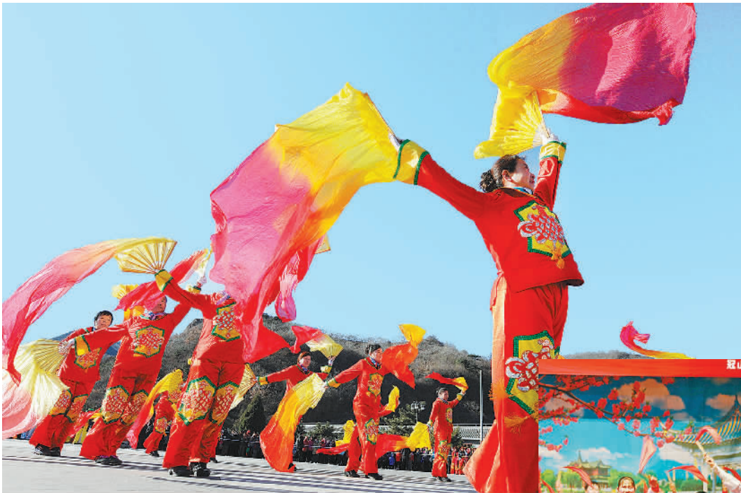
左图 2月6日，北京平谷区刘家镇农民跳起欢快的秧歌。当日，主题为“展丫警风情赏百年老会”第二十届农民艺术节暨花会秧歌表演擂台赛在平谷区刘家店镇举行，46档民间老会和传统秧歌、广场舞依次上台打擂。

看病买药所剩无几，日子过得十分艰难。 2016年5月，沈煤集团驻村工作队员在走访中了解到王庆山家的情况后，向集团公司提出对王庆山等12个重点贫困户牵手结对帮扶的建议。在“扶贫结对”工作中，沈煤集团焦煤公司副总经理蒋凤辰主动与王庆山结成扶贫互助对子。 为帮助王庆山一家彻底摆脱贫困，蒋凤辰和驻村工作队员们商定了详细的帮扶方案。修缮房屋，置办新被褥和全套厨具，入冬前送来羽绒棉服……“送钱、送物‘输血’只能缓解眼前的困境，有了致富产业项目才能让贫困户主动‘造血’持续脱贫。”荆洪涛说道。 秋天，一收完地，驻村工作队员和村干部们一起动手帮王庆山盖起了羊