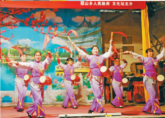
右图 2月6日，正月初十，江西吉水县冠山乡浒岭村里的小礼堂，村里的“扁担剧团”正在表演腰鼓《中国歌舞美》。冠山乡农民扁担剧团成立于1966年，由浒岭村村民组成，他们一根扁担挑满道具，被乡亲们称为“扁担剧团”。