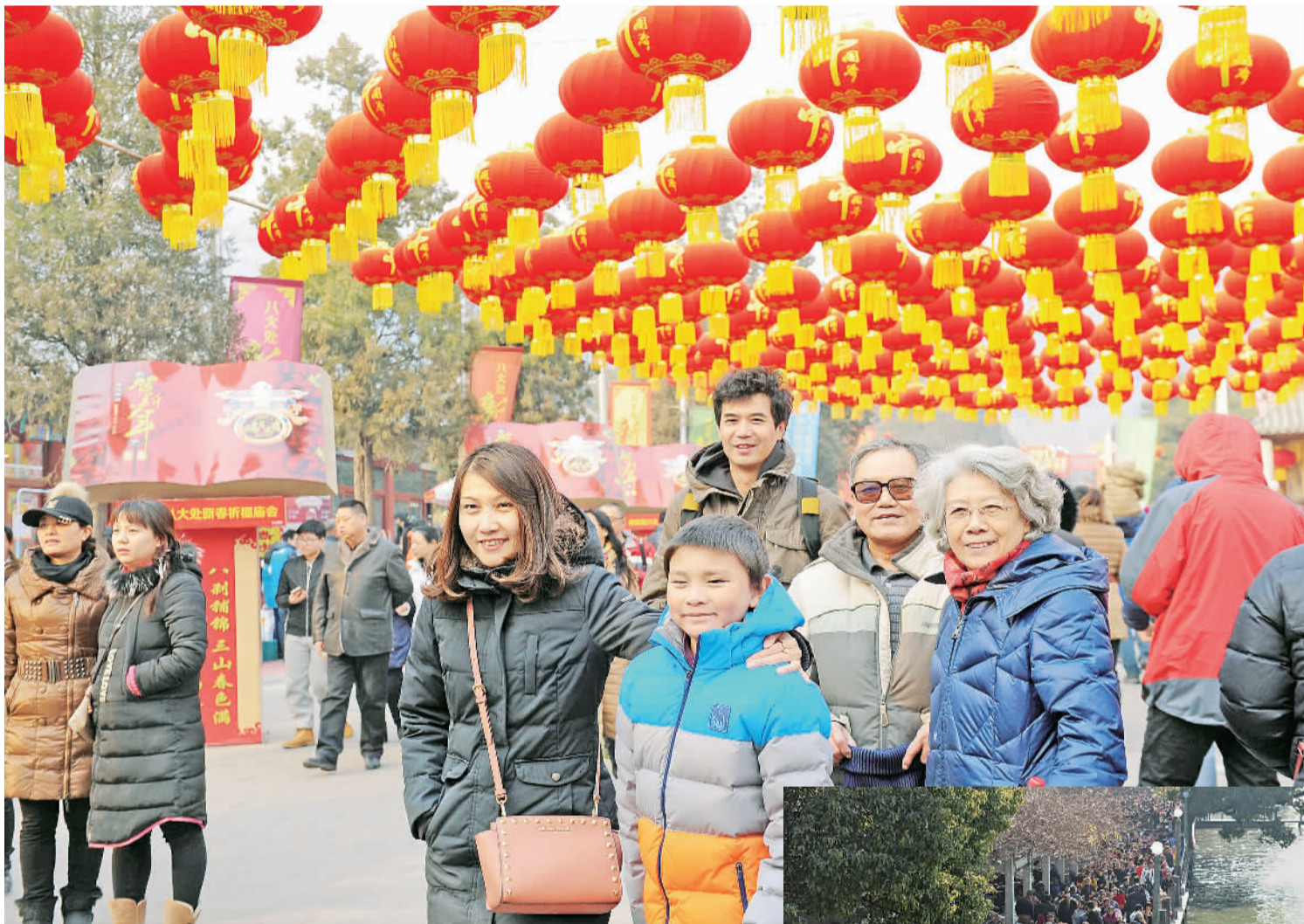
下图 1月29日,一艘小船驶过游人如织的杭州西湖岸边。