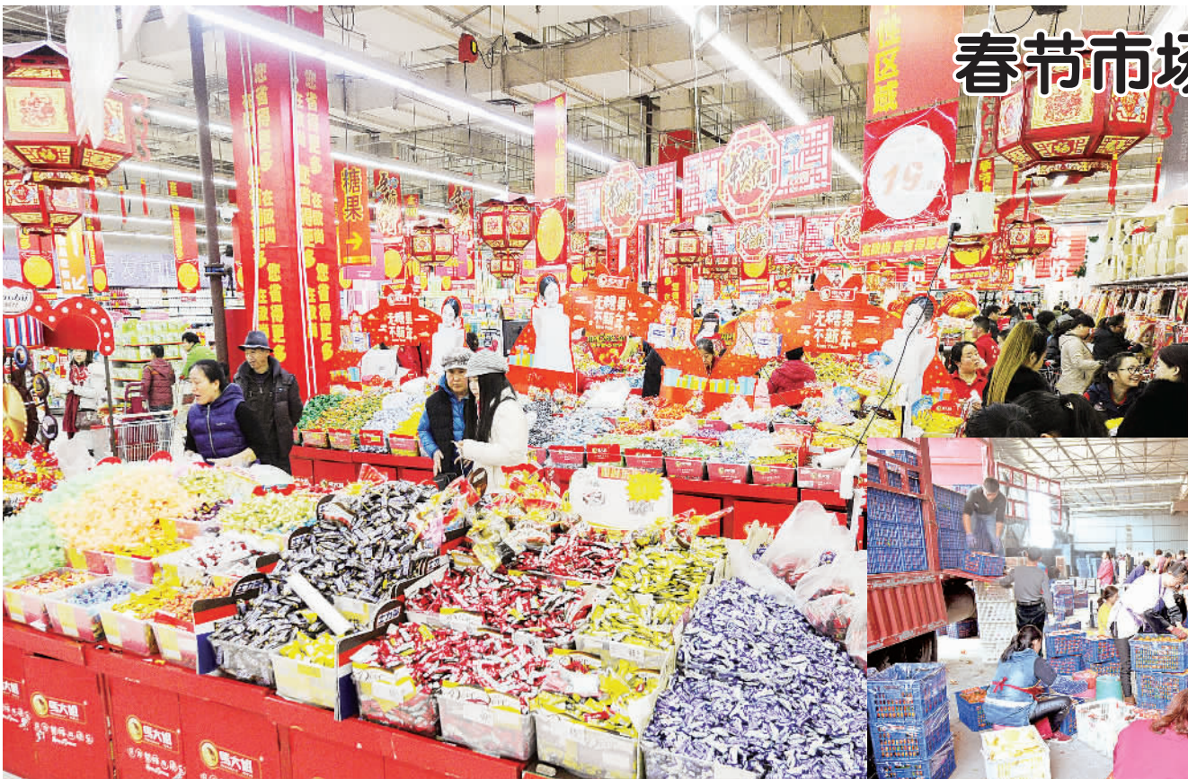
右图 1月29日，江西南丰县市镇翠云村吴氏果业集团组织农民工加班加点分拣、加工包装南丰蜜橘，准备销往全国各地，满足春节市场消费者的需求。

2016年辽宁省棚改开工14.1万套，货币化安置比例达到75%。此外，改造农村危房2.28万户，改建农村公路4402公里、村内道路6051公里，老百姓居住条件进一步改善。 让民生提速，让百姓满意。辽宁不断把保障和改善民生作为推动振兴发展的出发点和落脚点，使振兴发展的成果更多惠及百姓。2016年，辽宁城镇居民人均可支配收入达32860元，实际增长4%；农村常住居民人均可支配收入达12870元，实际增长4.9%。