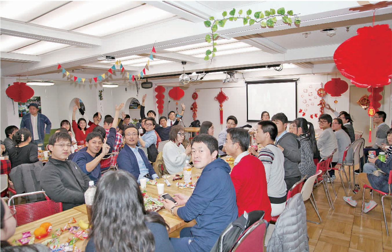
留日学子在中国农历除夕联欢,看春晚。

了海外华人华侨的热烈反响。 1 月 27 日除夕夜，在日求学的 180 多名留学生欢聚在东京留学生之家后乐寮，大家一起包饺子，做游戏，看春晚。在春晚节目中，每当看到喜欢的演员出场，大厅内就响起热烈的欢呼声。每一个优秀节目演出结束后，同学们又报以热烈的掌声。 在纽约，记者随机采访了当地的华人华侨。他们表示，像以往春晚一样，2017 年央视春晚也是海外华人除夕非常期待的重要晚会，不仅是全球华人的精神盛宴，更是联结全球华人的重要文