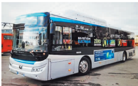
图为中国宇通公司为保加利亚生产的纯电动公交车。

本报索非亚电 记者田晓军报道：继去年秋季保加利亚进口110辆宇通客车之后，宇通公司生产的纯电动公交车也加入了索非亚的公交系统。这也是保加利亚投入使用的第一台纯电动公交车，无任何有害气体排放，是宇通专门根据欧洲城市需求设计和制造的。据悉，这款纯电动客车身长12米，续航里程可达250km，最高时速85km。该车可实现驱动电动化、转向电动化、制动电动化、空调电动化的“电动四化”，实现了真正的“纯电动客车”装备。索非亚市公交公司透露，该公司计划明年购买20辆纯电动公交车充实公交系统。