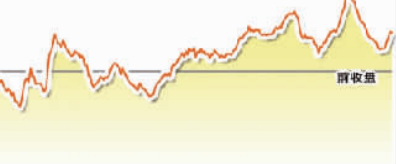
1月24日上证综指走势图