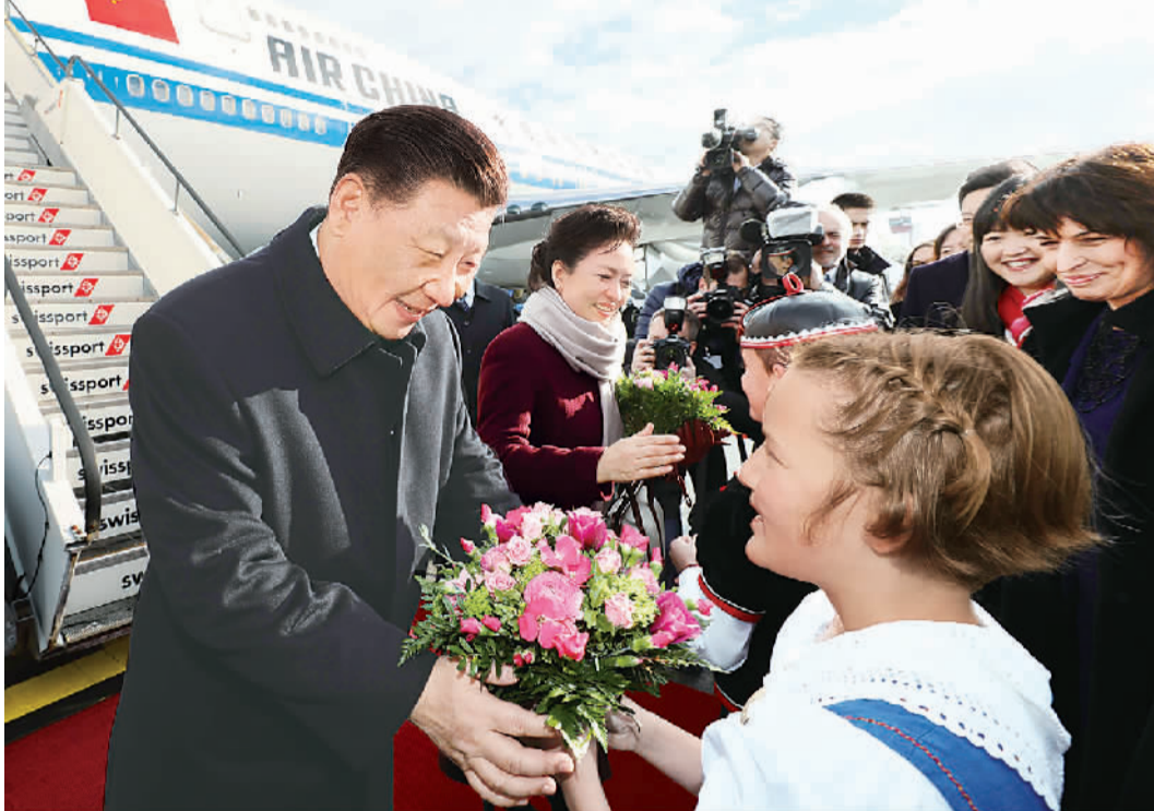
1月15日,国家主席习近平乘专机抵达苏黎世,开始对瑞士联邦进行国事访问。这是当地儿童向习近平和夫人彭丽媛献上鲜花。