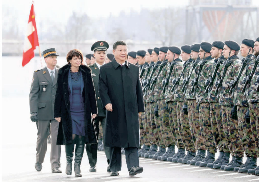
1月15日,国家主席习近平乘专机抵达苏黎世,开始对瑞士联邦进行国事访问。这是习近平在瑞士联邦主席洛伊特哈德陪同下检阅仪仗队。