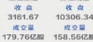
上证综指 收盘 3161.67 成交量 179.76亿股